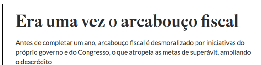
Figura 2: Editorial do Estadão (2024)

A segunda afirmação implica que, mesmo quando o sujeito detecta um gênero em uma situação comunicativa, deve em seguida assimilar de quais formas o gênero pode ser repaginado em sua função. Por exemplo, quando alguém ouve: “Era uma vez...”, deduz, com esse prólogo, que se trata de uma história ficcional ou uma fábula, porém deve ser capaz de assimilar um novo teor significativo, caso se trate de uma história verdadeira ou de algo inesperado como por exemplo: