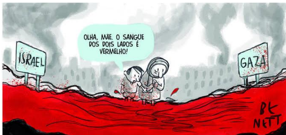
Figura 4: Benett (2024) Fonte: Site Folha de S. Paulo.

Trata-se mais uma vez de uma tragédia. A charge publicada em outubro de 2023 retrata a quantidade de sangue derramado em meio ao recente conflito entre israelenses e palestinos, transversalmente imbricado com a presença da organização paramilitar Hamas. No cartum uma criança fala para a mãe: “Olha, mãe, o sangue dos dois lados é vermelho!”.