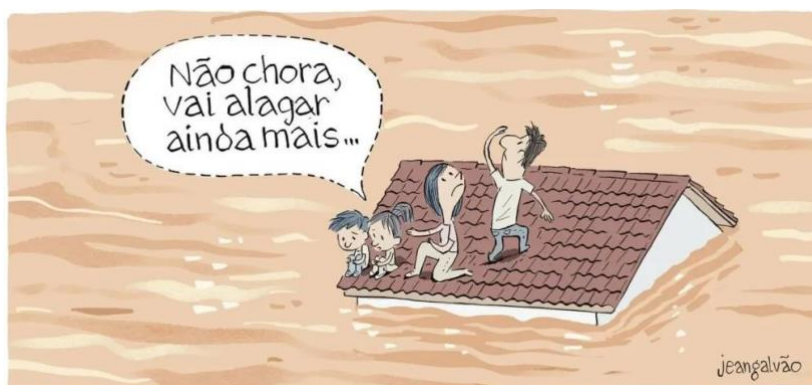
Figura 1: Charge de Jean Galvão (2024)

Em meio a esse embalado emaranhado de discursos, o cartunista brasileiro Jean Galvão publicou pelo jornal Folha de São Paulo a seguinte charge que será a principal matéria desta discussão: