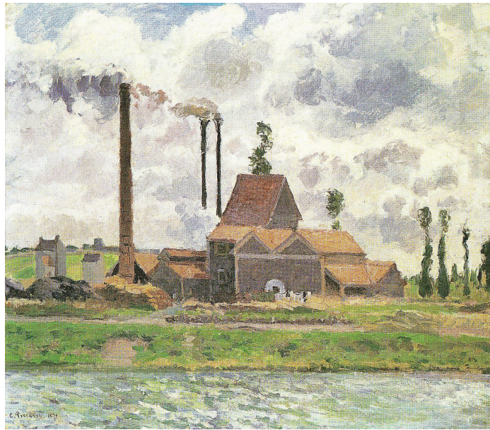
Camille Pissarro, Usine à Saint-Quen-L'Aumône , 1973

Além de retratarem as transformações ocorridas nos territórios entre a cidade e o campo – a banlieue –, os impressionistas representaram pictoricamente a maneira com que os parisienses, principalmente os pertencentes às camadas mais abastadas, se apropriaram do espaço público e dos locais voltados para o entretenimento, criados à ocasião. Conforme já mencionei, a movimentação dos transeuntes elegantes nas largas avenidas da cidade, os passeios de homens e mulheres burgueses nos parques fundados por Haussmann, bem como os encontros e comemorações nos cafés foram demasiadamente focados por essa vertente artística. Produzido por Renoir em 1875, Les Grands Boulevards é uma pintura que expressa, claramente, essa proposta temática impressionista: