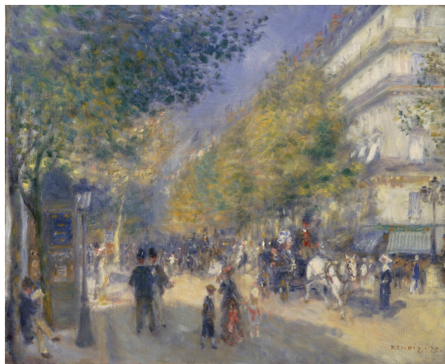
Auguste Renoir, Les Grands Boulevards , 1875

Além de retratarem as transformações ocorridas nos territórios entre a cidade e o campo – a banlieue –, os impressionistas representaram pictoricamente a maneira com que os parisienses, principalmente os pertencentes às camadas mais abastadas, se apropriaram do espaço público e dos locais voltados para o entretenimento, criados à ocasião. Conforme já mencionei, a movimentação dos transeuntes elegantes nas largas avenidas da cidade, os passeios de homens e mulheres burgueses nos parques fundados por Haussmann, bem como os encontros e comemorações nos cafés foram demasiadamente focados por essa vertente artística. Produzido por Renoir em 1875, Les Grands Boulevards é uma pintura que expressa, claramente, essa proposta temática impressionista: