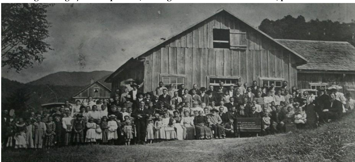
Figura 7: Igreja de Gaspar Alto, SC. Segunda Conferência do Estado, por volta 1906.