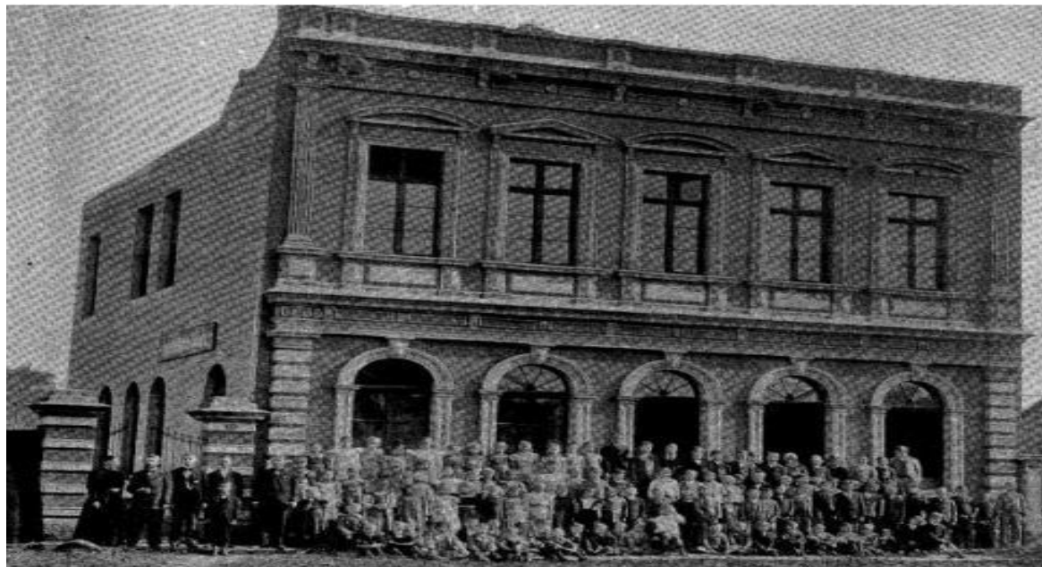
Figura 5: Discentes e docentes do Colégio Internacional de Curitiba – em sua segunda sede.