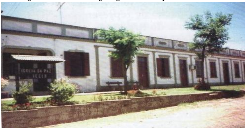
Figura 8: Prédio do Colégio e gráfica em Taquari no RS, em 1985.