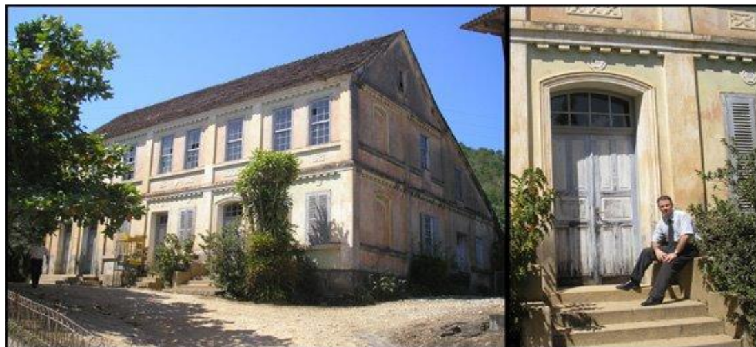
Figura 1: Casa comercial do senhor Davi Hort, local em que chegou o pacote de literatura adventista em 1884. Foto tirada na década de 1990.