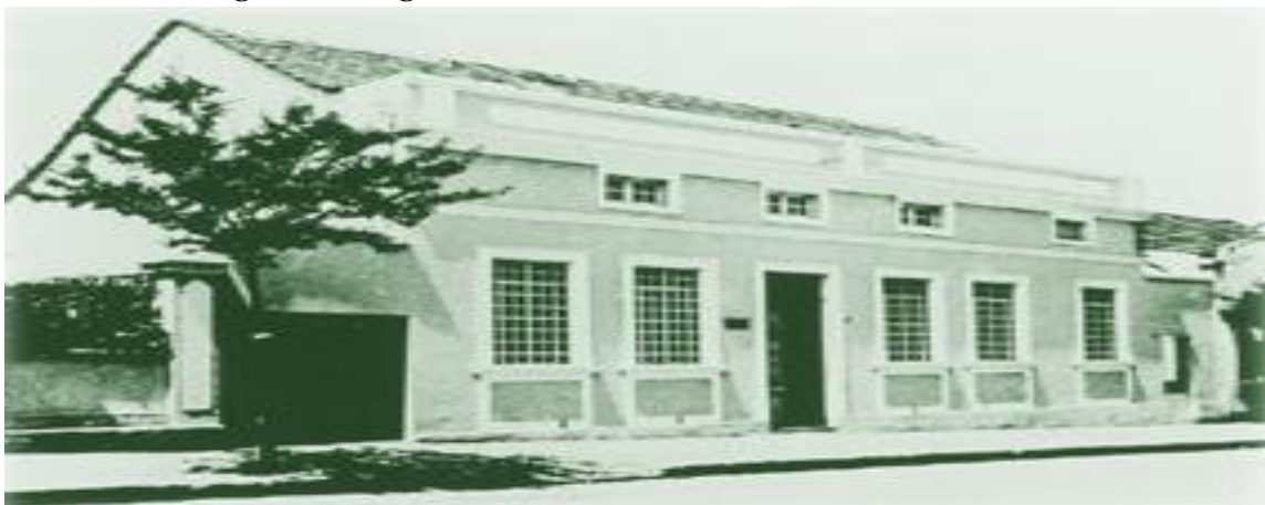
Figura 2: Colégio Internacional de Curitiba 1895 – Curitiba, PR.

Fonte: http://www.criacionismo.com.br/2012/08/as-primeiras-instituicoes-adventistas.html .