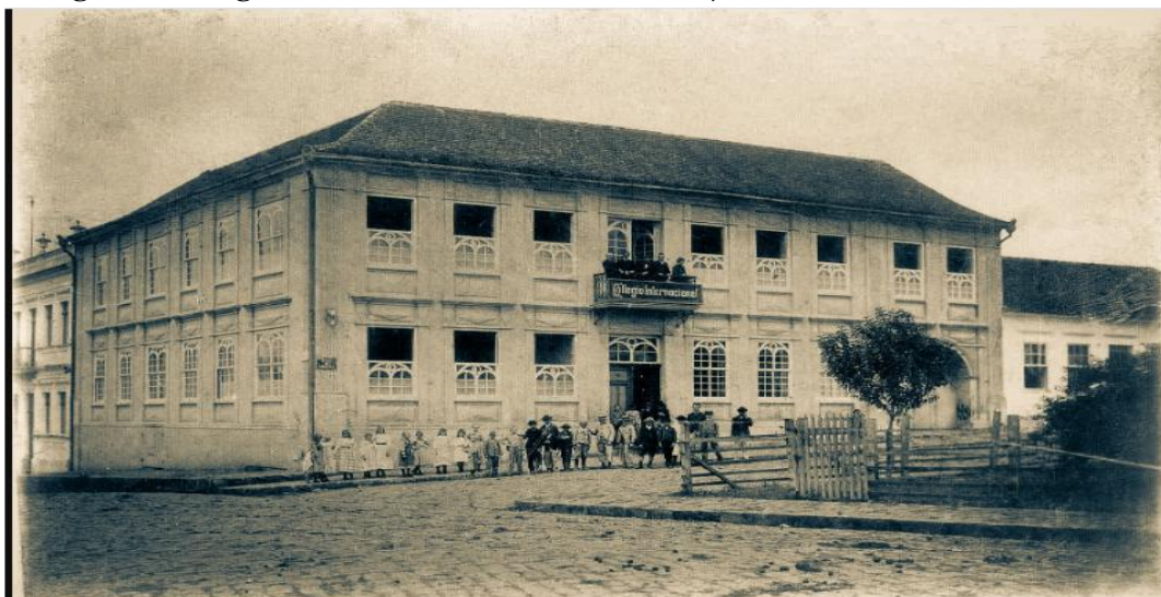
Figura 3: Colégio Internacional de Curitiba 11 de julho de 1896 – Curitiba, Brasil.