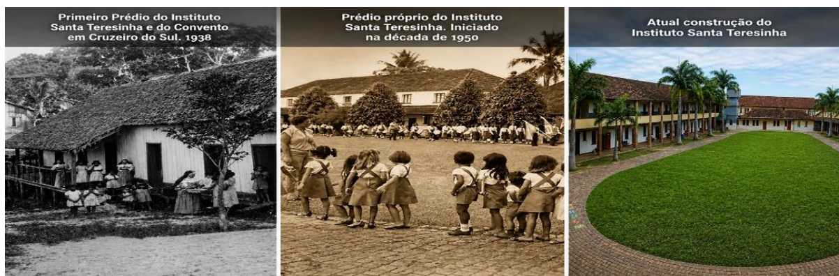
Figura 1 – Prédios do Instituto Santa Teresinha, décadas de 1940, 1950 e atual.