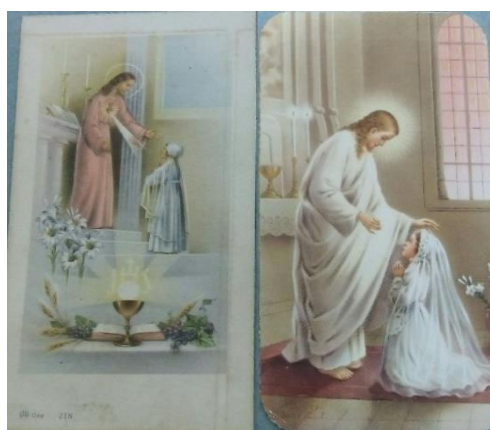
Série IIFC, menina