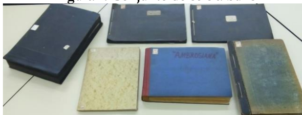
Figura 1: Conjunto de seis álbuns

Fonte: Memorial Jesuíta Unisinos (2009).