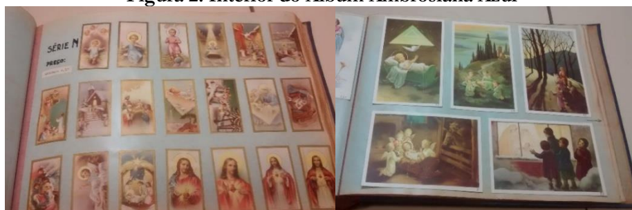
Figura 2: Interior do Álbum Ambrosiana Azul