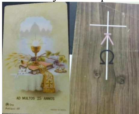
25 anos de sacerdócio Luto