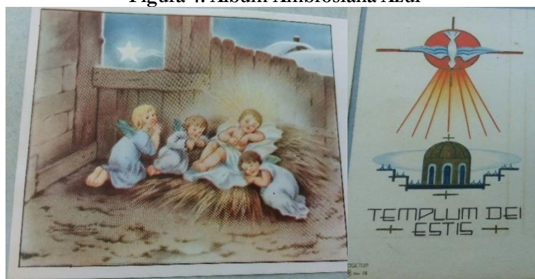
Série Lieta e Serena