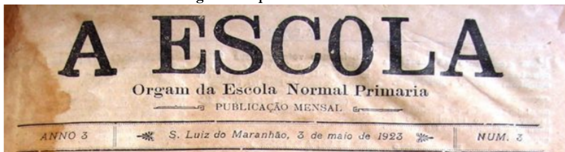
Figura 1: Capa da revista A escola

Nas palavras de Gouvea (2008), os jornais se constituíram, ao longo do século XIX, como um elemento essencial na disseminação de ideias sobre a educação, possibilitando compreender a dinâmica dos debates sobre a escolarização da população brasileira. Nessa perspectiva, selecionamos uma diversidade de publicações dos jornais “Pacotilha” e “O jornal” e da revista “A escola”, principais meios de disseminação de informações pedagógicas. A seguir o registro da capa destes dois meios de divulgação: