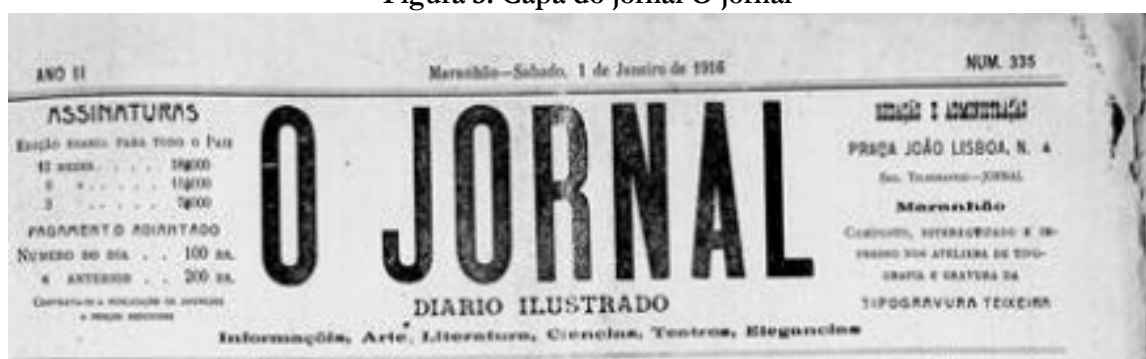
Figura 3: Capa do jornal O jornal