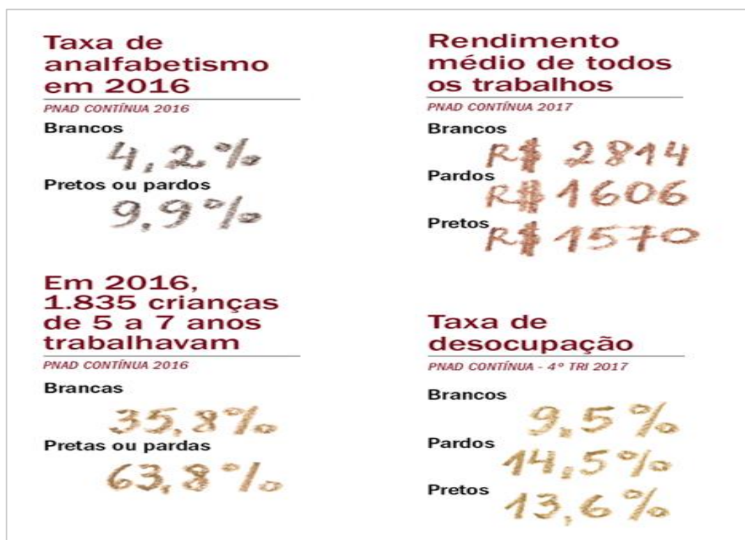
Gráfico 1 - IBGE mostra as cores da desigualdade