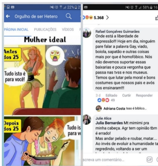
Fonte: Orgulho de ser Hetero , 2018