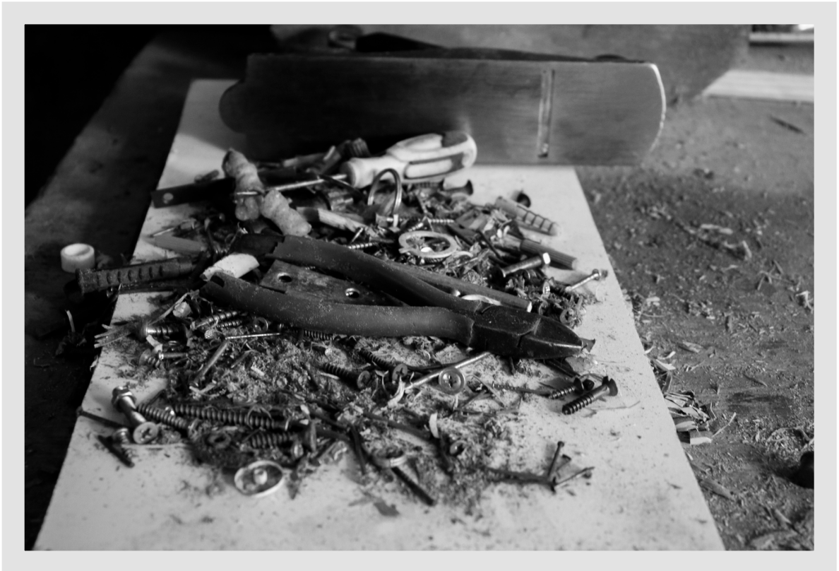
Fez alguns bicos com uns “gatos” e depois abriu sua própria oficina, onde trabalha até hoje.