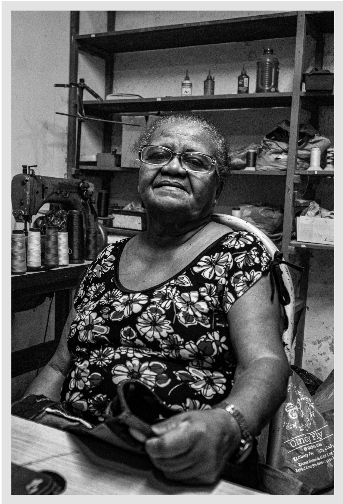
72 anos, natural de Pernambuco, da cidade de Limoeiro. Aprendeu a costurar com a mãe, aos 12 anos já costurava com a máquina.