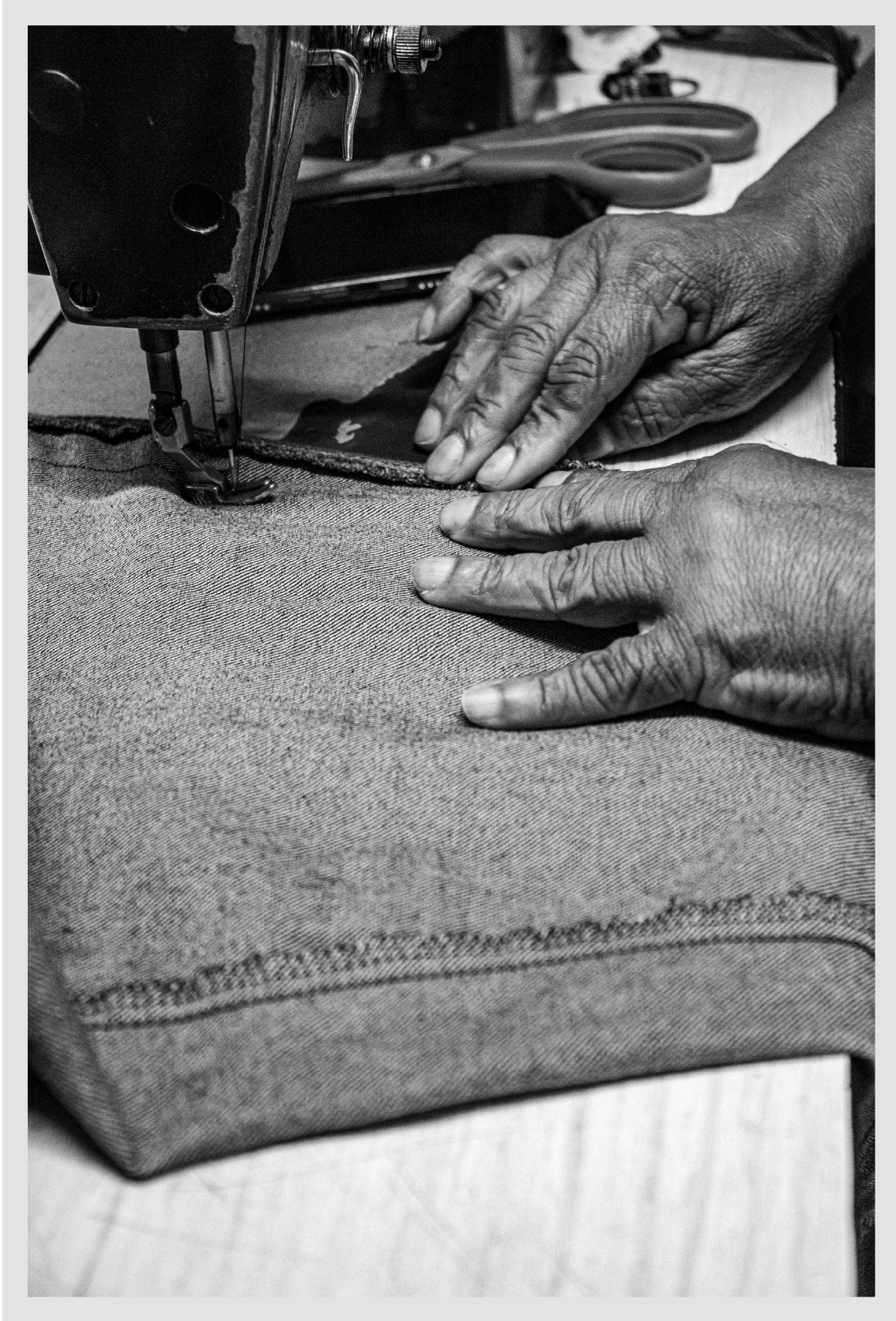
Quando completou 15 anos, fez curso de corte e costura. Chegou no Rio de Janeiro com 18 anos.