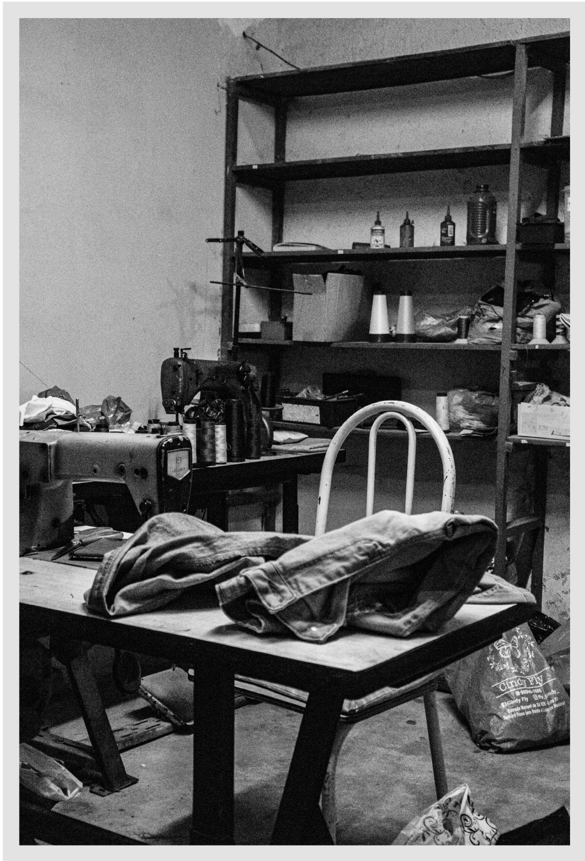
Trabalhou em fábrica, mas parou porque ficou grávida da sua primeira filha (ela tem três meninas e um menino).