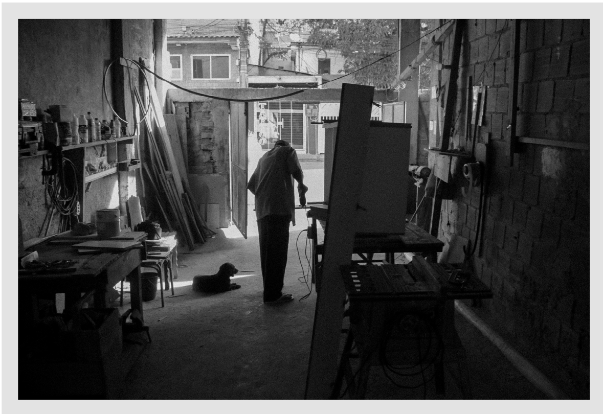
Pedi as contas e foi trabalhar como servente de carpinteiro. Em 1973, tirou a carteira de autônomo como marceneiro.