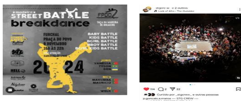
Figura 2. Divulgação e registro do momento do evento

Na composição histórica, a dança do Break surgiu “dos guetos norte-americanos invadiu novos territórios, transpôs barreiras nacionais e conquistou jovens de outras classes econômico-sociais, ensinando a outros jovens a possibilidade de produzir novas formas de existência na vida e na dança” (ALVES & DIAS, 2004, p.02). Segue o card e a imagem do alto (Figura 2) publicado no Instagram sobre um evento realizado na cidade de Funchal, onde inspirou a pesquisa do doutorado sanduíche: