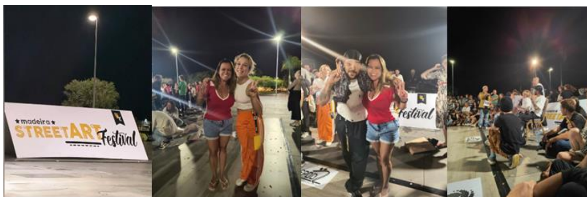
Figura 3. Momento do encontro Fonte. Elaborado pela pesquisadora, 2025.

mobiliza em termos de atenção. Em muitas vezes inusitados, ações e realizações surgem de composições inesperadas [...]” (MACEDO, 2024, p. 108). Esses registros são, de fato, o resultado de um momento singular que desejamos eternizar, pois nos permitem narrar experiências por meio de expressões que traduzem sentidos e sentimentos. Tal compreensão está em consonância com Macedo (2024, p. 104), para quem “a foto é produzida pelo encontro, literalmente”. Recordo que esse encontro foi especialmente marcante: ao chegar à Praça do Povo, percebi que estava imersa nos quatro elementos do Hip-hop e tive a oportunidade de dialogar com alguns de seus representantes, inclusive com um dos jurados brasileiros, como evidenciam as imagens a seguir.