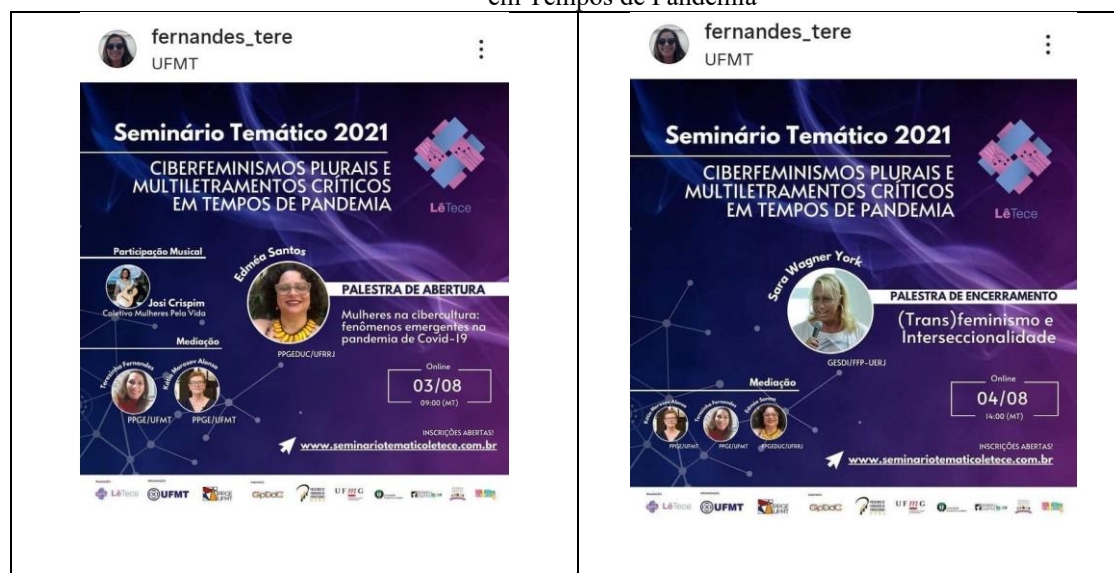
Imagem 3: Cards das Palestras do Seminário Temático “Ciberfeminismos Plurais e Múltiplos Usos Críticos em Tempos de Pandemia”