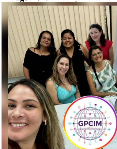
Imagem 02: Orientação Coletiva