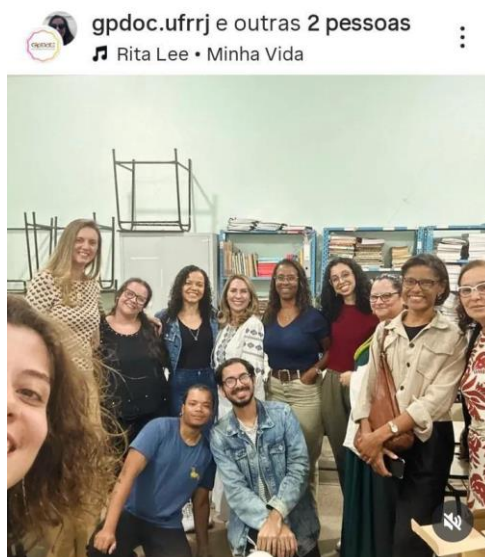
Imagem 6: Encontro do GpDoc em 03/06/2025 na UFRRJ