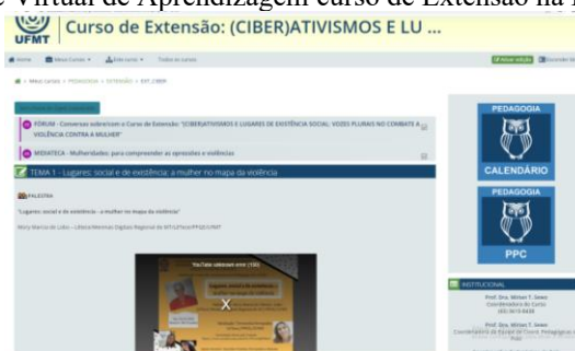
Imagem 4: Ambiente Virtual de Aprendizagem curso de Extensão na Pedagogia EaD/UFMT