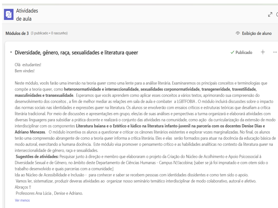
Figura 2. Módulo 1 de Seminário Temático Interdisciplinar I – Diversidade, gênero, raça, sexualidades e literatura queer.

de ementa por módulo de estudo foi coerente, mas coube à docente editar, atualizar, e organizar conforme os objetivos, escolher os textos e instrumentos de avaliação. O que potencializou a organização da aula foi ter o tempo otimizado para realizar a pesquisa, seleção de textos e elaborar os instrumentos avaliativos da aprendizagem. Observem na imagem a seguir os módulos sugeridos com a edição da docente, inserção de textos para estudo, links, entrevistas etc.