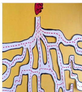
Ilustração de Gabriela Jaques