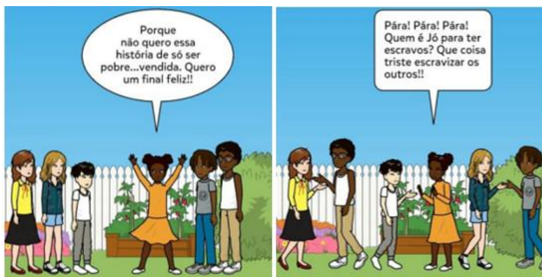
Figura 2: parte da produção de HQs produzido por uma Aluna do 9º ano