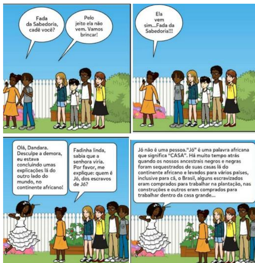
Figura 3: parte da produção de HQs produzido por uma Aluna do 9º ano