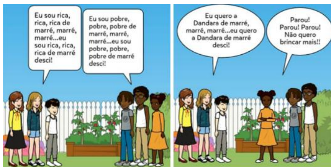
Figura 1: parte da produção de HQs produzido por uma Aluna do 9º ano