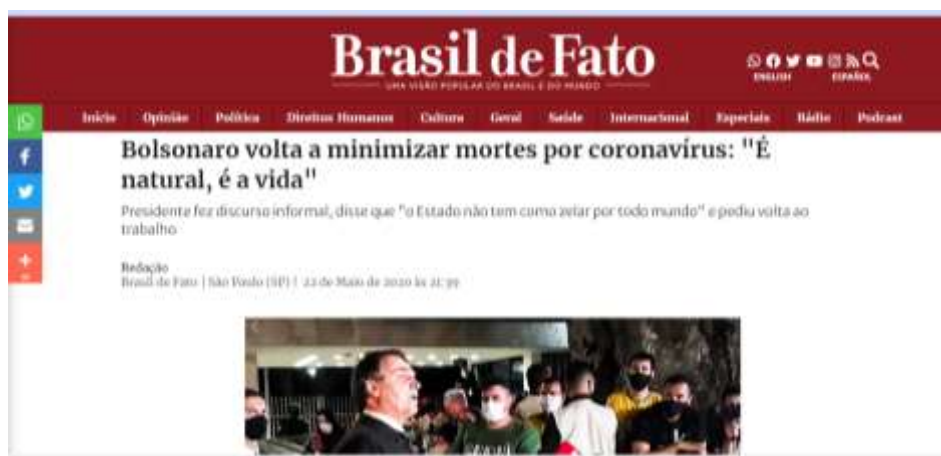
Figura 2 - Banalizando a vida dos mortos por Covid 19