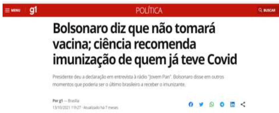
Figura 1 - Discurso negacionista de Bolsonaro sobre vacina de Covid 19 Fonte: Globo. com. Outubro, 2021.