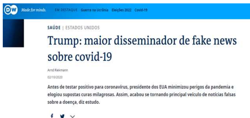
Figura 3 - Fake News sobre Covid 19 por Donald Trump