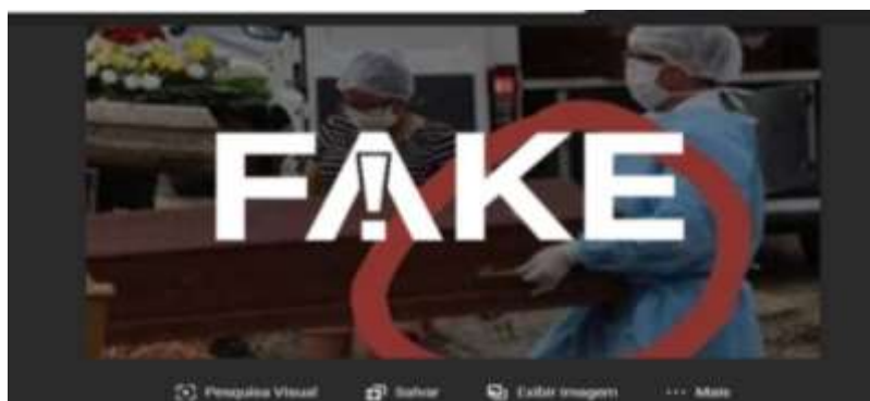
Figura 5 - Fake News com caixões vazios de mortos por Covid 19