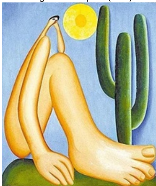
Figura 1: "Abaporu" (1928)