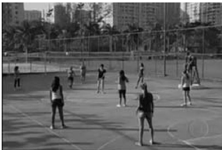
Cândido et al. (2015).

Cena extraída da 18ª temporada da telenovela Malhação