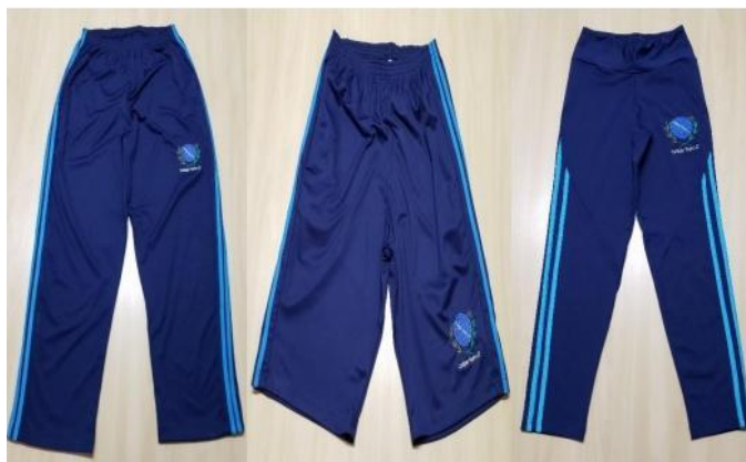
Colégio Pedro II (2024).

Ao analisarmos as imagens que representam momentos históricos distintos do CPPII, observamos uma evolução nas representações sociais dos uniformes de Educação Física. Isso confirma a ideia de Moscovici (2012) de que as representações sociais sobre objetos podem se transformar ao longo do tempo, refletindo as mudanças nas condições sociais.