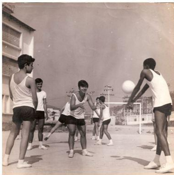
Faria Júnior (2011, p. 1).

Ao longo da produção deste texto, um detalhe que chamou nossa atenção foi o fato de que, nas imagens das aulas de Educação Física de outros estados brasileiros, mais