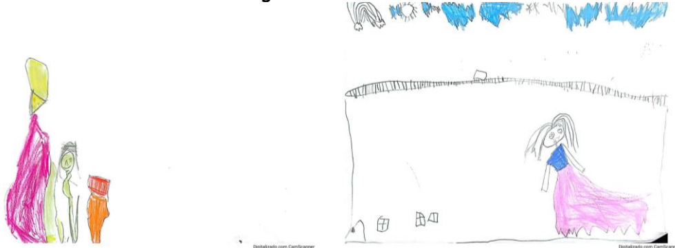
Figuras 3 e 4 - Raio e Lua

No desenho da estudante "Sol", a figura (2) convida a mergulhar em um universo de emoções e reflexões. Enquanto desenhava, ela falava que "a escola era para estar aberta, porque é lugar de aprender."