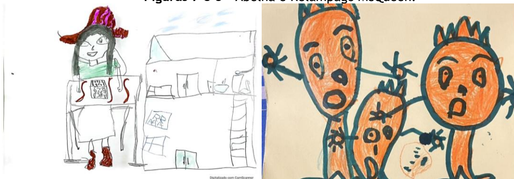
Figuras 7 e 8 - Abelha e Relâmpago McQueen.

evidenciando a falta de atividades e a monotonia da rotina, resumidas na palavra "ruim", que foi utilizada para descrever o período.