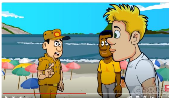
Fig. 1 – Participantes da narrativa.

No que diz respeito à representação imagética dos participantes representados (pessoas, objetos e cenário), a charge apresenta as seguintes escolhas semióticas, conforme figura1: