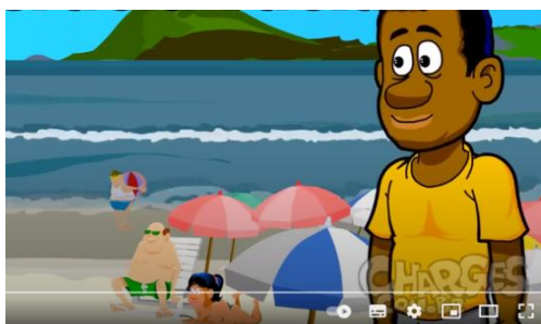
Fig. 2 – Participante de cor negra

Na apresentação do cenário, o chargista representou a praia de Copacabana, um espaço frequentado por pessoas de nível social mais elevado. Os participantes secundários são todos retratados como sendo da raça/etnia branca (figura 2).