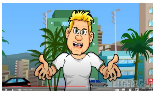
Fig. 4: Participante de cor branca

Outro recurso semiótico a ser destacado é o enquadramento. Há cenas em que o enquadramento se apresenta aberto, mostrando o cenário da praia, em outras, é possível observar um enquadramento médio, como a figura 4, em que o personagem é apresentado da cintura para cima.