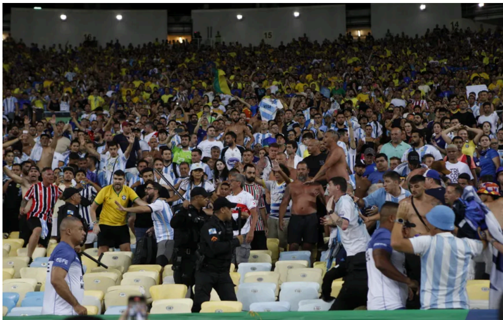
Figura 4 Estádio como território de disputa