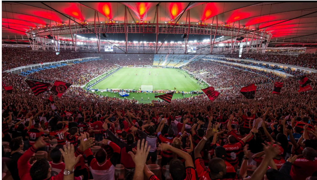
Figura 3 O “setor organizado”

por todo o globo, são um terreno fértil para se pensar territorialidade, poder e geografia de maneira geral.