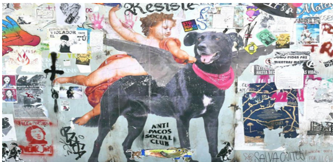
Foto 4:. Imagem do Negro Matapacos nas paredes do centro cultural Gabriela Mistral.

Nos confrontos diários com os Carabineros (polícia chilena), havia cães, alguns deles celebridades em suas cidades — por exemplo, Rucío Capucha em Santiago, Matapacos em