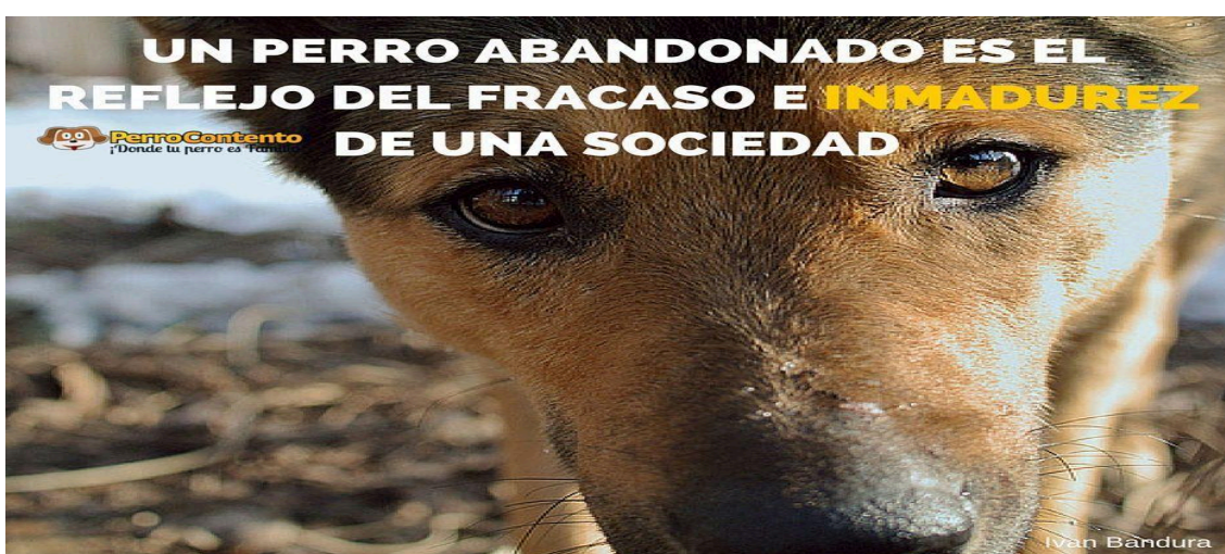
Foto 3:

2) os esforços disciplinadores de sua vida presentes nos regulamentos públicos (como a Lei Cholito) e, até, no desempenho de grupos ativistas de cuidado responsável (que assumem que todos os cães abandonados pertenceram em algum momento a alguém); 3) na atenção de grupos ecológicos que denunciam a presença de matilhas na caninas nas periferia das cidades e em ambientes selvagens, mesmo os mais ermos. Nestes espaços, as relações antrozoogenéticas baseadas na confiança recíproca perdem força, cedendo a dispositivos conflitivos e controversos, regulados, comumente por esforços disciplinares ou baseados na exclusão.