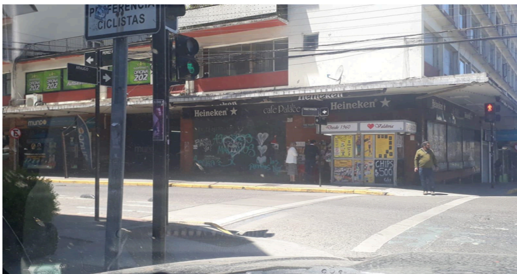
Foto11. Café Palace depois dos protestos de 2023

No entanto, é possível inverter essa pergunta e questionar se essa mudança na política humana alterou os sinais da política interespecífica revelados na época do estallido ? Aqui é necessário destacar algo interessante: mesmo na guinada à direita da política chilena é possível encontrar figuras semelhantes às do estallido social nas relações interespecíficas. A hipótese sugerida é que, se há uma guinada na política representativa humana em direção a