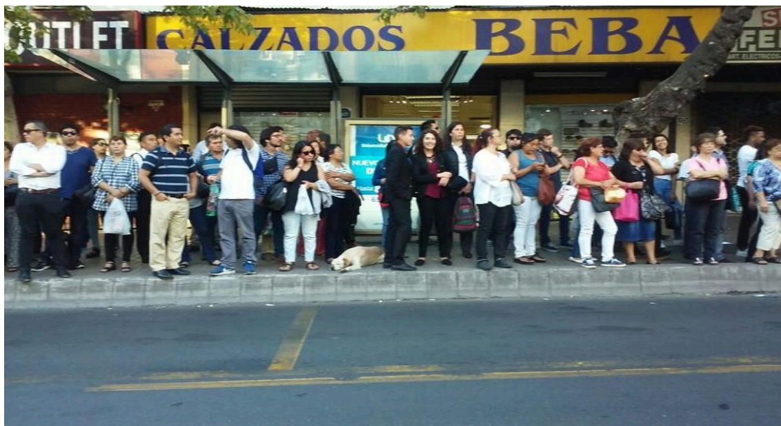
Foto 1: Cão dormindo tranquilamente em um ponto de ônibus em Santiago.

O cuidado observado não é apenas legal (como na Lei Cholito) 12 , mas cotidiano e de muitos (não necessariamente animalistas ou defensores do cuidado responsável). Existem muitas controvérsias sobre alimentar ou cuidar de cães de rua, mas ainda é possível observar um cuidado distribuído e não meritório ou individualizado. Também é possível observar cotidianamente como os cães buscam companhia humana (uma espécie de carona) para atravessar regiões perigosas para eles.