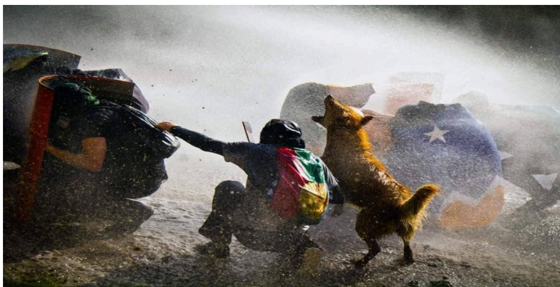
Foto 6: Rucio Capucha em ação.

A primeira questão, sem dúvida, é um tema para um trabalho histórico mais abrangente, que deixarei para futuros desdobramentos. A segunda questão levantada, "O que significa lutar como um cão?", encontra um obstáculo real na ciência política contemporânea.