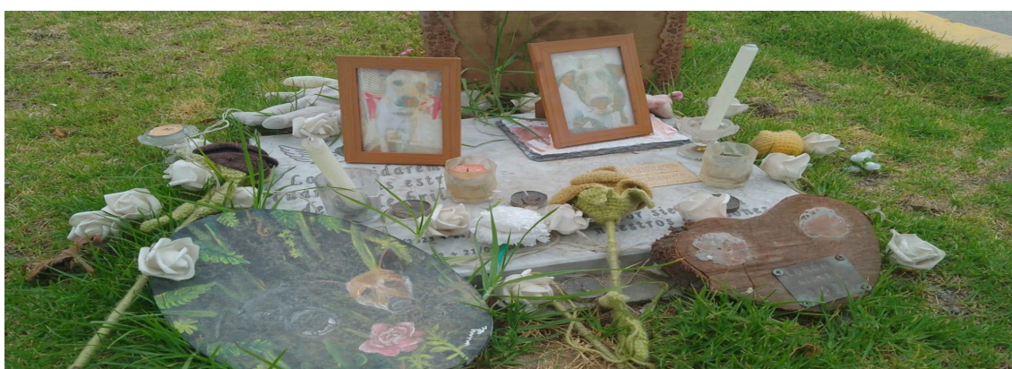
Foto 12. Animitas de Negrito e Llorón.