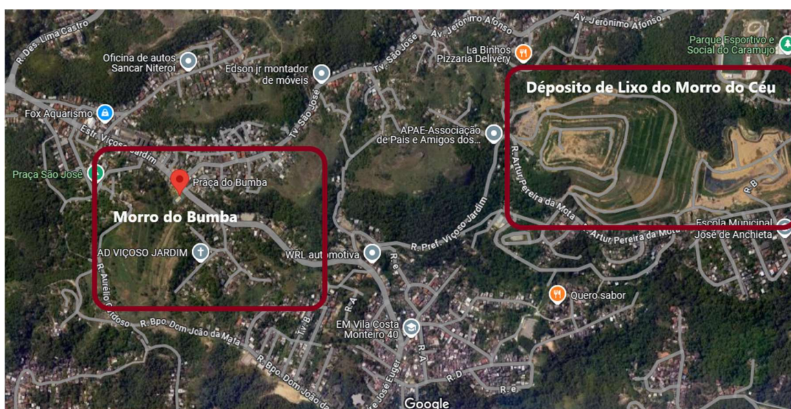
Fig. 2. O Morro do Céu e o Morro do Bumba. Mapa adaptado pela autora.

O cenário ambiental e social do Morro do Céu alterou-se drasticamente a partir dos anos 1980, seus recursos naturais foram definitivamente comprometidos com a instalação do depósito de resíduos de Niterói, que até aquele período funcionava em uma região próxima, no Morro do Bumba, em Viçoso Jardim 9 .