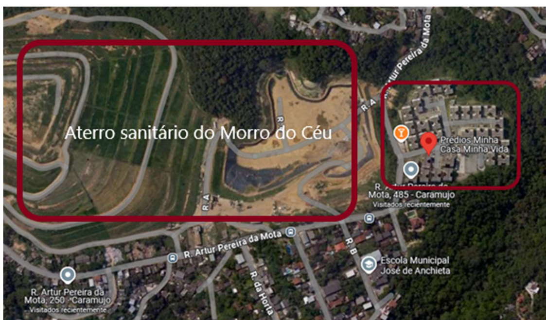
Fig. 4. Conjunto Habitacional e Aterro Sanitário do Morro do Céu. Mapa adaptado pela autora.

Já o conjunto residencial do empreendimento Minha Casa, Minha Vida foi destinado às famílias que estavam em situação de risco, ou seja, habitando áreas com chances de sofrer com deslizamentos no Morro do Bumba e no condomínio Maria Thereza, construído anos antes. Os primeiros 140 apartamentos, do total de 600, foram entregues em 2016, tendo como critério de escolha famílias com renda de até três salários mínimos 28 .