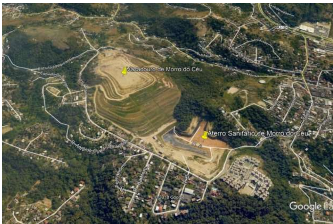
Fig. 3 Vazadouro do Morro do Céu e Novo Aterro Sanitário do Morro do Céu. Foto: Google Earth. Disponível em: https://www.jb.com.br/rio/caderno_niteroi/2019/12/1020678-meio-ambiente---prefeitura--clin---inea-e-aguas-de-niteroi-sao-denunciados-por-crime-ambiental.html .

Pode-se perceber, a partir desse relato, a dificuldade e a contradição vivida pelos moradores do Morro do Céu, já que a localidade foi onerada pelo funcionamento de um aterro sanitário e, ainda assim, não possui um posto de saúde para o atendimento das pessoas que sofrem com os riscos de viver tão próximas de um vazadouro e de um centro de tratamento de resíduos.