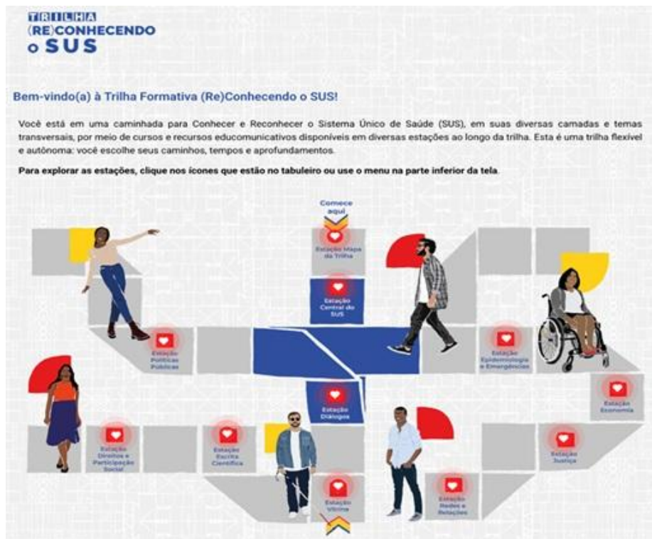
Figura 1 — Tabuleiro do SUS: interface gamificada da Trilha (Re)Conhecendo o SUS