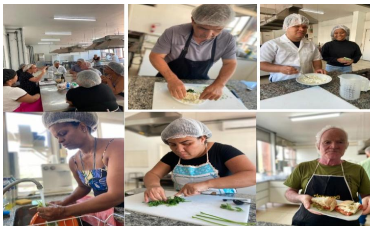
Figura 2 — Atividade teórica e preparo de receita com temperos e a atividade de pré-preparo e preparo de hortaliças para pequenas refeições

É relevante destacar que as habilidades culinárias foram desenvolvidas de forma didática ao longo do curso, envolvendo os estudantes em todo o processo, uma vez que a identificação e superação de desafios e obstáculos se mostra importante para a melhor concretização dos objetivos do curso. As oficinas culinárias foram organizadas em um grupo reduzido, heterogêneo (2 pessoas com baixa visão e 4 pessoas com cegueira) considerando sempre o nível de acuidade visual e o grau de autonomia necessária para a realização das tarefas culinárias (Figura 2).