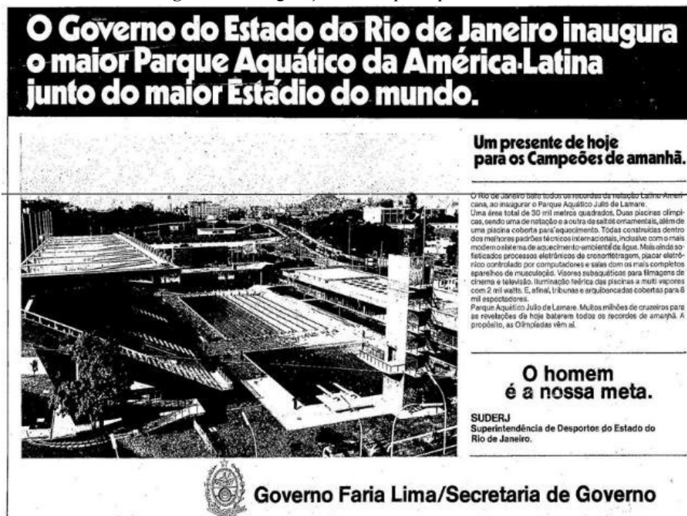
Figura 3 – Inauguração do Parque Aquático Júlio Delamare

O Parque Aquático Júlio Delamare (figura 3), de maneira similar ao Célio de Barros, também desempenhou, durante décadas, importante função esportiva e social, servindo como espaço de treinamento e competição aquática para atletas de alto rendimento e local de aulas de natação e de hidroginástica para a comunidade em geral, além da oferta de projetos sociais direcionados especialmente para a população mais vulnerável situada no seu entorno (CASTRO et. al. , 2015).