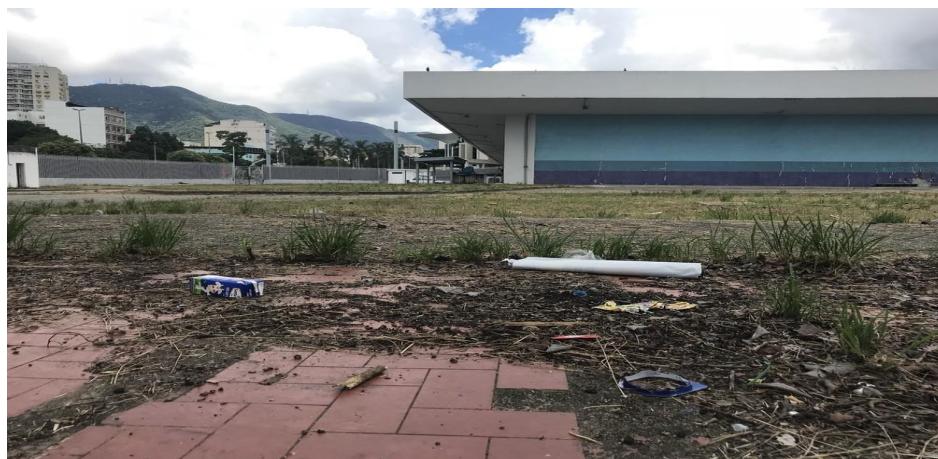
14 de fevereiro de 2018.

Apesar da promessa de reforma do Parque Aquático Júlio Delamare, prevista para ocorrer no ano de 2016, a imagem acima ilustra que a situação de abandono persistiu, pelo menos, por mais dois anos, data da foto acima. Dessa forma, pode-se afirmar, a princípio, que entre o período de 2013 e início de 2018, esse fixo esportivo situado no CEM ficou obsoleto em relação a sua função original e, com isso, atletas e comunidade desterritorializados de suas práticas cotidianas.