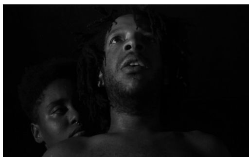
Imagem 2 – Filme Não pense que sabe ser quem é.