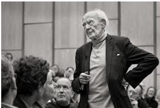
Figura 1. Sociólogo Zygmunt Bauman (1925-2017) .

Fonte: http://obviousmag.org/archives/uploads/2013/12/01_bauman.jpg