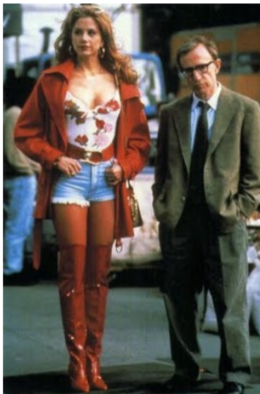
Figura 8: Mira Sorvino e Woody Allen 5

Em 1995, vinte anos depois de Deus e dez anos depois de A Rosa Púrpura do Cairo , Allen recorre novamente ao Deus Ex Machina . No filme Mighty Aphrodite (no Brasil, Poderosa Afrodite ), sua personagem, Linda, é a mãe biológica do filho adotado pelo personagem encarnado pelo próprio Woody Allen. Ele a procura na busca das raízes genéticas da genialidade do filho, mas se decepciona quando encontra uma prostituta simplória e ingênua. Depois de muitas peripécias e metaficções, Linda tenta reatar com um antigo namorado para largar a prostituição, mas ele lhe dá um fora. Triste, Linda dirige pela estrada quando não mais do que de repente um helicóptero pousa, enguiçado, no campo ao lado da estrada. Ela para o carro e vai ajudar o piloto, que é também o dono do helicóptero e milionário. Linda acaba se casando com esse homem que caiu do céu como um verdadeiro, ainda que fictício, Deus Ex Machina .