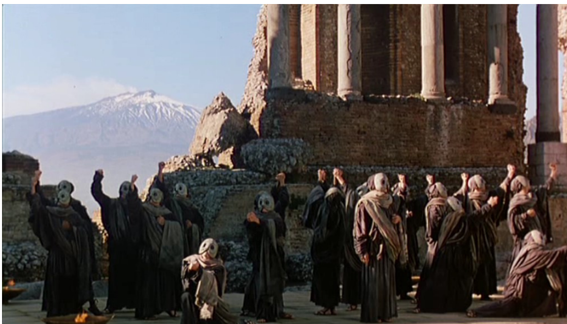
Figura 7 4

A expressão latina Deus ex machina deriva do grego apò mēchanēs Theós e significa literalmente “Deus surgido da máquina”. No teatro grego algumas peças, em especial as de Eurípidés, terminavam com um deus que surgia do nada com a incumbência de amarrar todas as pontas soltas da história. Normalmente, um guindaste o baixava até o local da encenação. Já Aristóteles criticava o recurso como forçado e inverossímil, considerando-o uma espécie de apelação. Desde então a expressão é usada para indicar qualquer solução inesperada e improvável ou para terminar uma obra de ficção ou para resolver uma situação problemática na chamada vida real: