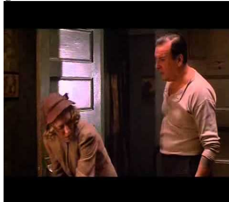
Figura 4: Mia Farrow e Edward Herrmann

Cecília, vivida no filme pela atriz Mia Farrow, mostra uma igreja para Tom, vivido no filme pelo ator Jeff Daniels. Digo que ambos são “vividos no filme” para enfatizar a necessidade de ambos em viverem e serem vivos, apesar de na verdade ambos não serem de verdade, isto é, de ambos serem personagens de ficções – uma dentro da outra. O curto diálogo entre esses dois-personagens-que-querem-ser-mais-do-que-personagens sintetiza muito bem o pensamento de Woody Allen, mais um judeu sem Deus, a respeito de Deus.