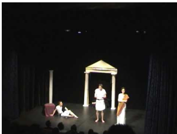
Figura 6 3

Aqui caberia perguntar se o criador dos criadores seria igualmente irônico, mas deixo a pergunta no ar para talvez discuti-la em outro capítulo. Por ora, volto a uma peça do mesmo Woody Allen, publicada dez anos antes, em 1975. Essa peça trazia um título curto e provocador: God . Em português: Deus . Em Deus , vários personagens discutem a montagem de uma peça de um certo escritor chamado, por mero acaso metaficcional, Woody Allen. Em determinado momento, “Zeus, o Pai dos Deuses, desce dramaticamente das alturas e, brandindo seus raios, traz a salvação para um grupo de mortais agradecidos mas impotentes”. No original: “Zeus, Father of the Gods, descends dramatically from on high and brandishing his thunderbolts, brings salvation to a grateful but impotent group of mortals”. A descida repentina de Zeus no palco remete ao recurso teatral conhecido desde as antigas tragédias gregas como Deus ex machina :