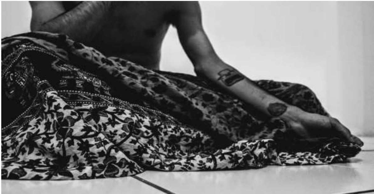
764 x 510, Recife-PE.

O intuito noticiado é o de debatermos, nutridos de um repertório pós-estruturalista, os enlaces que constituem os discursos sobre corpo e gênero, entrevedo as implicações de uma imagem pedagógica, uma visualidade que manifesta resistência contra toda uma inteligibilidade. Facultando neste gesto potente uma moda-militância, prática político-performativa que reivindica algo mais radicalmente comprometido: um presente longe de capturas normativas, que se apresenta por hora, em notas de manifestação.