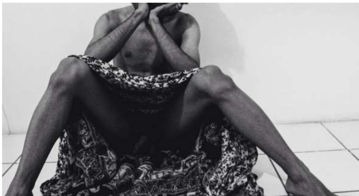
756 x 520, Recife-PE.

Pensamos, neste sentido, a imagem pedagógica como o efeito de uma prática queer, como algo que advoga a contingência, a imagem pedagógica se apresenta como uma política performativa que evidencia mesmo sem exterioridade a norma, o trânsito que os corpos na história constituem, denunciando que categorias como feminino e masculino são fabricados e fictícios.