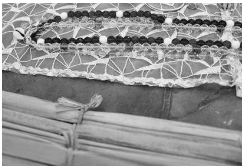
Figura 4. Fios de contas e esteira.