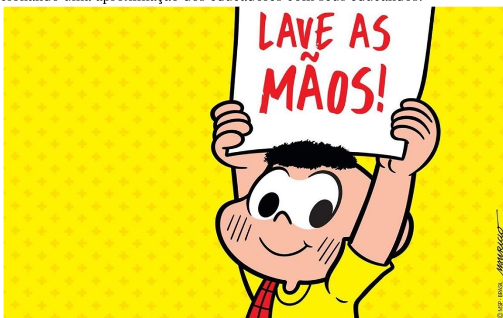
Figura 1. Plano de proteção contra o Coronavírus