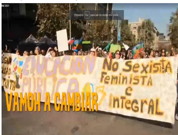
Imagem 14 – Captura de tela do vídeo 2