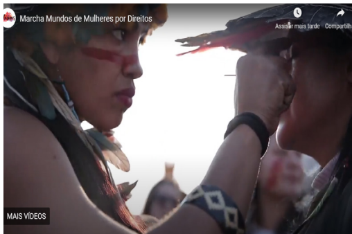
Imagem 3 – Captura de tela do vídeo 1