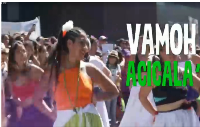
Imagem 8 – Captura de tela do vídeo 2