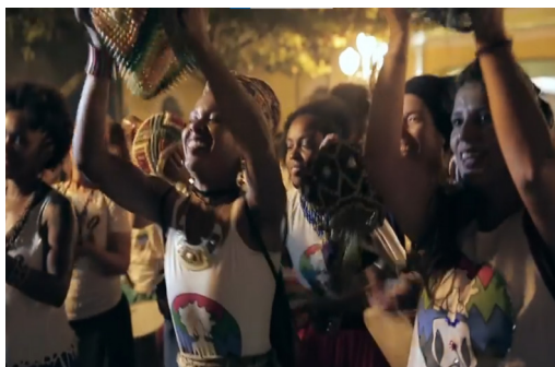
Imagem 4 – Captura de tela do vídeo 1