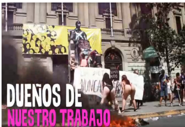
Imagem 9 – Captura de tela do vídeo 2