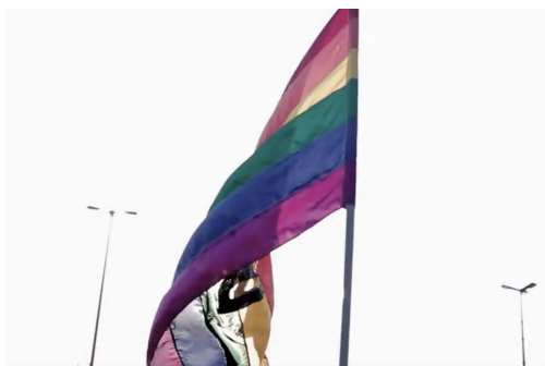
Imagem 2 – Captura de tela do vídeo 1