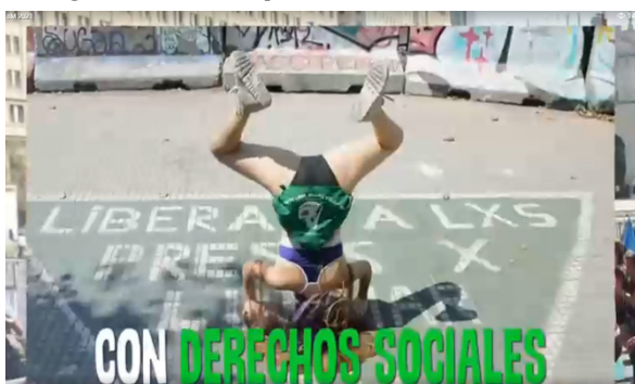
Imagem 10 – Captura de tela do vídeo 2