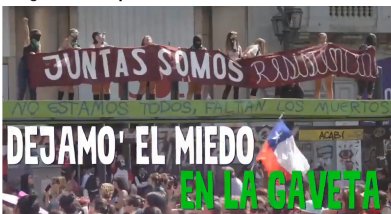
Imagem 12 – Captura de tela do vídeo 2

lise de imagens recorrentes na mídia tradicional, a função deste recurso “escrito” em provocar um “direcionamento de sentidos” das imagens, que acaba conduzindo e restringindo o processo de interpretação, considerado pela AD um processo de interlocução entre sujeitos em diferentes posições. No caso desse vídeo, essa função se vê subvertida, na medida em que a combinação da montagem com as imagens expostas e os trechos destacados quadro a quadro ampliam a rede de significados das imagens com frases como “Greve, porque não podem conosco” 9 , destacadas do jingle que acompanha o vídeo chileno.