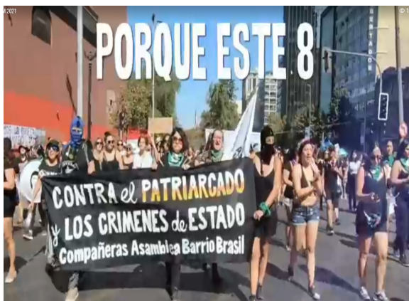
Imagem 13 – Captura de tela do vídeo 2