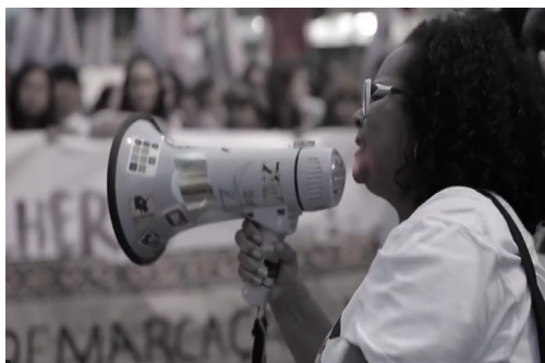
Imagem 1 – Captura de tela do vídeo 1

O manifesto passa a ser registrado a partir da movimentação interna que vai desde os encontros às performances, aos atos de sacudir bandeiras, tocar um instrumento, se tocarem, se despirem, dançarem, gritarem, portar cartazes, pintar os corpos, exibir os corpos e o caminhar lado a lado. Mesmo que seja um caminhar para um destino final, há uma descontinuidade interna do caminhar que a câmera procura registrar. É importante destacar que o processo de montagem é feito com a consciência de que o papel do resultado estético final deve romper com a lógica da representação jornalística e documentarista tradicional, e trabalhar mais o registro das sensações. A ocupação, no caso das imagens, se dá nesse campo das sensações, dos afetos e da experiência estética. Convém observar também que o trabalho do som aliado à montagem é fundamental no vídeo em questão. A abertura com a voz de uma mulher cantando enquanto assistimos a uma profusão de imagens internas da manifestação tem a função de dramatizar as cenas. A linguagem de videoclipe, além de funcionar de forma atraente, ressalta a diversidade de pautas em cena. Dos 4min 26s de filme, a montagem das imagens casadas à música de fundo ocupa cerca de dois minutos.