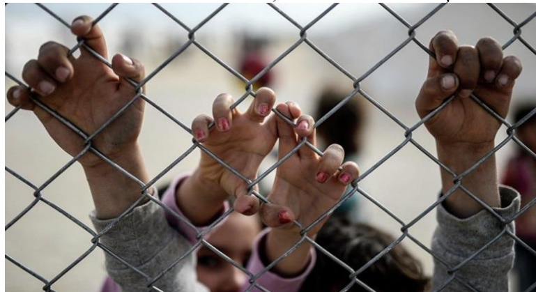
Figura – 12: Fecho da fronteira alemã em maio de 2016, sob as “ordens” balouçantes de Merkel

os refugiados/migrantes, tanto ao longo do seu itinerário errático 8 pela Europa amuralhada, como nos campos de internamento do tipo nazi, onde também o ‘outro’ – judeu, comunista, homossexual, cigano... – era espezinhado pelos agentes da “banalidade do mal”, como diria Hannah Arendt. Este paralelismo, que “desafia o pensamento”, não pode deixar de ser evocado quando assistimos às “ordens” (à maneira das que Eichmann invocou em tribunal) a que obedecem os decisores alemães que comandam a UE. Assim, a chanceler Merkel, depois de declarar inicialmente que o seu país estava pronto a receber uma quota considerável de fugitivos, cedo (em meados de maio de 2016) se prontificou a obedecer a ininteligíveis “ordens” para fechar a fronteira alemã aos refugiados (vd. Fig. 12) que sobreviviam à ‘rota dos Balcãs’, cedendo talvez à pressão maléfica da CSU, (União Social Cristã, partido indispensável à coligação no poder). Por fim, o governo alemão cedeu em receber a sua quota de refugiados, desde que esta contemplasse apenas sobreviventes das guerras do Médio Oriente que se revelassem cumpridores escrupulosos de um “programa de integração” top-down baseado no inefável “conhecimento da língua” e na atribuição de um qualquer Arbeit , que continua a macht frei (como em Dachau).