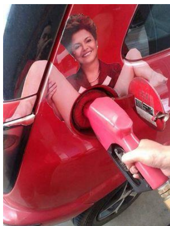
Figura 1 A imagem, viralizada em 2015, não revela somente o descontentamento com a prática política da presidenta da República. Expressa o machismo e a misoginia entranhados na sociedade brasileira, promotores de uma cultura do estupro 5 .

Mas, como indica Certeau (1994), nossas práticas cotidianas são marcadas pelos usos que empreendemos de tudo aquilo que produzimos e/ou consumimos. Para ele, os homens e mulheres comuns, em suas práticas de usuários do que não foi por eles fabricado e que lhes foi oferecido ou imposto pelo mercado ou pelo Estado, criam outros possíveis com suas operações, produzindo sempre diferença em uma combinação singular de artes de fazer a partir do repertório dominante. Tais artes de fazer, que também constituem modos de saber, implicam uma produção secundária informada pelos desejos e interesses dos praticantes da cultura. Dito de outra forma, se há memes que narram violências, há outros que comunicam resistências.