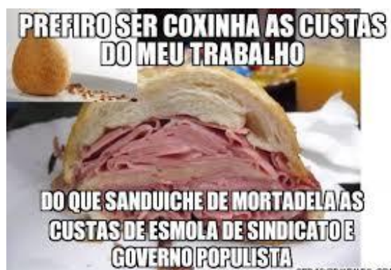
Figura 7 A complexidade da luta de classes deu lugar, no Brasil, a uma divisão simplória, mas de grande apelo ideológico: coxinhas x mortadelas. Tal polarização, inspirada no antagonismo entre direita e esquerda, sintetizou práticas veladas (às vezes nem tanto) de inúmeros preconceitos.

A confissão de Jucá - que não o levou para a cadeia, tampouco cassou seu mandato - revela a dimensão do golpe em curso. Não se trata apenas de uma disputa político-partidária, mas de um projeto de poder, ou melhor, da tentativa de retomada de um tempo histórico ameaçado - embora não superado, pelos treze anos de governos petistas - com forte marcador de classe.