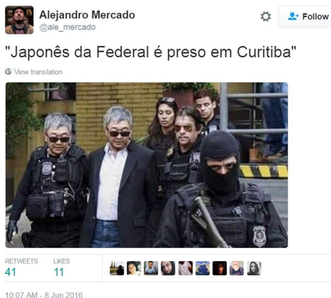
Figura 11 O "Japonês da Federal" tornou-se um símbolo das conduções coercitivas e das prisões de políticos e empresários. Um dia, ele mesmo foi preso. Os memes, então, informaram que o "Japonês da Federal" foi preso pelo "Japonês da Federal".

Faz parte da cena jurídica a adoção de termos pouco familiares aos não iniciados no Direito, o que acaba gerando incompreensões que dificilmente serão sanadas nos atropelos dos dias. Talvez, por essa razão, parte dos discursos sobre a Lava Jato tenha tomado a forma de imagens ( memes ) e não de palavras.