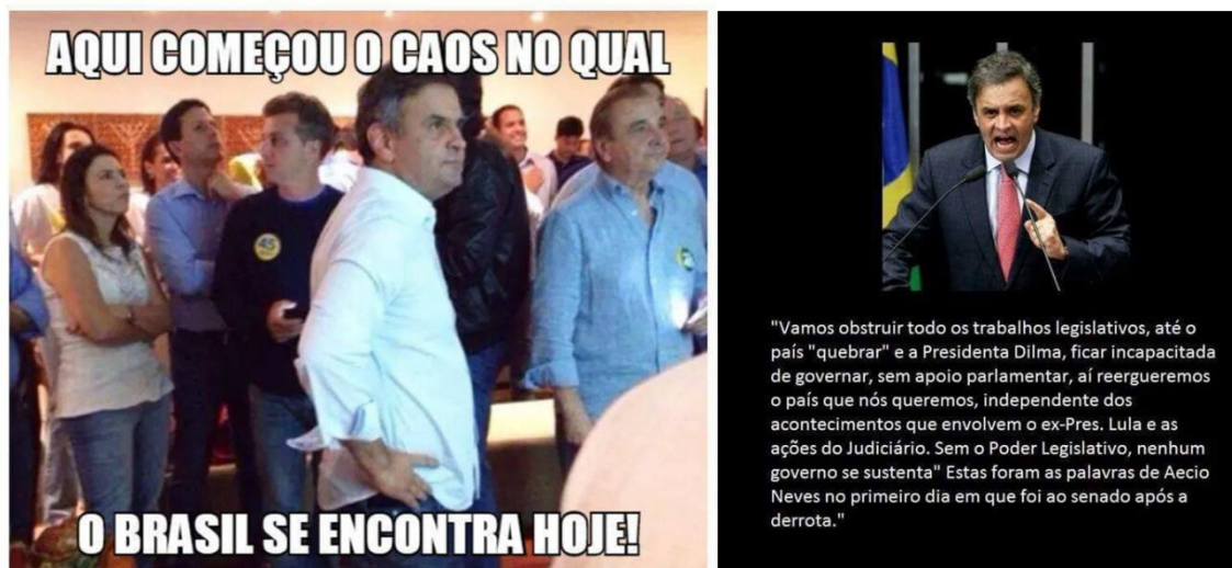
Figura 9 A imagem registra o momento em que Aécio Neves, cercado por apoiadores de sua campanha presidencial, recebe o resultado de sua derrota para Dilma Rousseff. Aécio promete fazer de tudo para não deixar Dilma governar.

A produção de ‘verdades’, fundamental para se costurar o golpe, ganhou respaldos jurídicos com a Operação Lava-Jato 11 que, entre muitos artifícios, elege uma visão moralista da corrupção para montar um constante Estado Policial, onde tudo é permitido para se garantir a ordem. Nos últimos anos, cenas de conduções coercitivas e práticas de busca e apreensão em casas de políticos e empresários, tornaram-se corriqueiras na televisão brasileira. Tornou-se comum, por volta das cinco ou seis horas da manhã, a deflagração de alguma fase da Operação Lava Jato, sempre com nomes estranhos, distantes do vocabulário corrente.