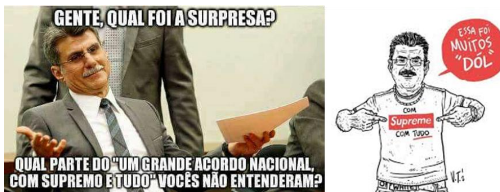
Figura 6 Meme criado a partir da conversa-confissão do Senador Romero Jucá (MDB-RR). Na ligação, interceptada pela Polícia Federal, o político conta detalhes do plano em curso para afastar Dilma Rousseff da presidência da república.

A confissão de Jucá - que não o levou para a cadeia, tampouco cassou seu mandato - revela a dimensão do golpe em curso. Não se trata apenas de uma disputa político-partidária, mas de um projeto de poder, ou melhor, da tentativa de retomada de um tempo histórico ameaçado - embora não superado, pelos treze anos de governos petistas - com forte marcador de classe.