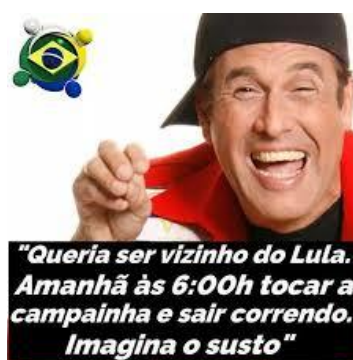
Figura 10 A rotina das prisões e conduções coercitivas virou piada na Internet, destacando a previsibilidade das ações "coincidentemente" concomitantes à programação matutina das emissoras de televisão (faixa marcada por programas jornalísticos e de variedades, geralmente ao vivo).

A produção de ‘verdades’, fundamental para se costurar o golpe, ganhou respaldos jurídicos com a Operação Lava-Jato 11 que, entre muitos artifícios, elege uma visão moralista da corrupção para montar um constante Estado Policial, onde tudo é permitido para se garantir a ordem. Nos últimos anos, cenas de conduções coercitivas e práticas de busca e apreensão em casas de políticos e empresários, tornaram-se corriqueiras na televisão brasileira. Tornou-se comum, por volta das cinco ou seis horas da manhã, a deflagração de alguma fase da Operação Lava Jato, sempre com nomes estranhos, distantes do vocabulário corrente.