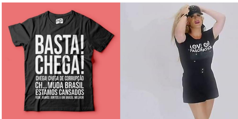
Figura 3 Na composição de imagens, temos o meme oriundo de uma cena realizada pelo humorista Paulo Gustavo. O texto da personagem (apresentada ao público como despolitizada, influenciável e à procura de fama) repete os clichês contra a corrupção, muito comuns nas redes sociais online.

Palavras de ordem e frases de impacto marcaram as manifestações nas ruas e na Internet, reunindo uma plêiade de críticas sob o guarda-chuva do combate à corrupção. Entretanto, a vulgarização de um discurso padrão contra a “corrupção dos tolos”, conforme argumenta Souza (2017), serviria para ocultar a corrupção real, da elite do dinheiro, que teria como cúmplices a grande mídia e setores da casta jurídica.