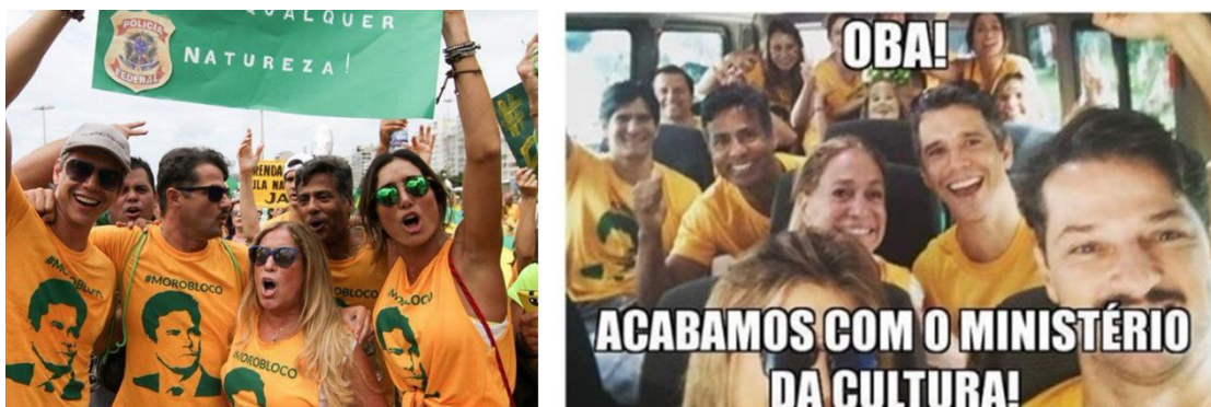
Figura 5 Artistas que participaram das manifestações pelo impeachment de Dilma Rousseff, admiradores do juiz Sérgio Moro, que comanda a Operação Lava Jato, viraram meme quando Michel Temer assumiu a presidência e extinguiu o Ministério da Cultura.

O golpe, hoje já sabido, embora não assumido por todos, não nasceu da noite para o dia. Foi arquitetado a partir de alianças múltiplas, com a imprensa, com os empresários, com parte do poder judiciário - que, segundo Souza (2016, p. 15), “também assalta o país com salários nababescos e vantagens de todo tipo que o mortal comum sequer sonha” -, com muitos artistas inconformados trajando camisetas da seleção brasileira, uma ribanceira com um monte de gente a flertar com o precipício.