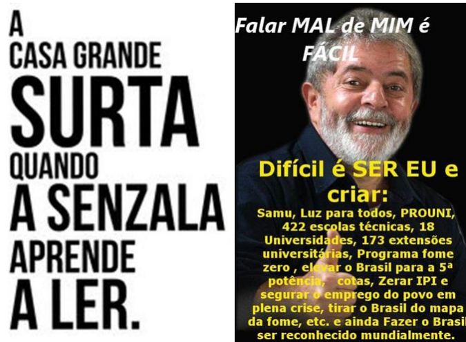
Figura 8 Alguns memes são capazes de sintetizar capítulos muito complexos da nossa história. A frase em tela, por exemplo, oferece pistas sobre a densa discussão acerca do racismo realizada por Souza (2017). A imagem do ex-presidente Lula alude ao argumento promovido por Frigotto (2017).

foram criadas, além de centenas de Institutos Federais de Educação, Ciência e Tecnologia; aumento real do salário mínimo; política de cotas; bolsa família; liberdade de organização para os movimentos sociais e culturais; mudanças substanciais nas relações exteriores, incluindo a participação do Brasil no BRICS 10 .