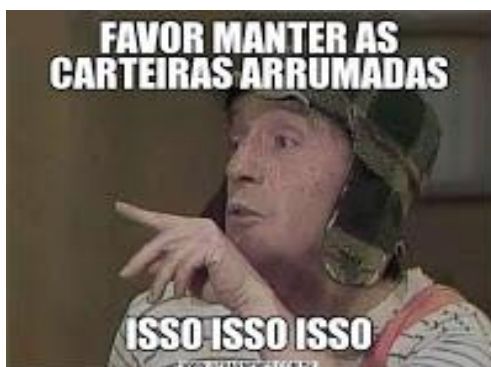
Figura 3: Meme criado pelos estudantes na aula de Língua Portuguesa

Nas aulas seguintes, ajudamos os alunos a selecionarem imagens e frases que fariam parte de sua criação, observando sempre a relação entre texto verbal e não verbal. E, depois que os memes foram criados, socializamos as produções com todo o grupo. Os memes das figuras 3, 4 e 5 foram construídos pelos alunos, utilizando como ponto de partida personagens do famoso seriado Chaves . Os textos fazem referência a algumas atitudes que colaboram para a destruição do patrimônio escolar ou tratam da importância de manter a estrutura da escola em boas condições, como manter as carteiras arrumadas e as salas de aula limpas.