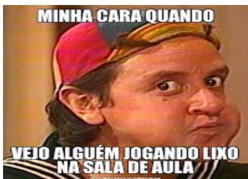
Figura 4: Meme criado pelos estudantes na aula de Língua Portuguesa