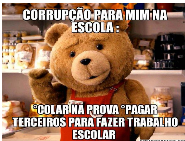
Figura 1: Meme sobre honestidade e corrupção

Fonte: Google imagens. Disponível em: https://goo.gl/images/nFKN4L . Acessado em: 10 maio 2018.