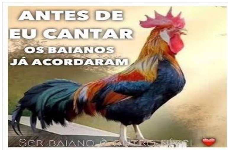
Figura 2: Memes sobre o estereótipo baiano