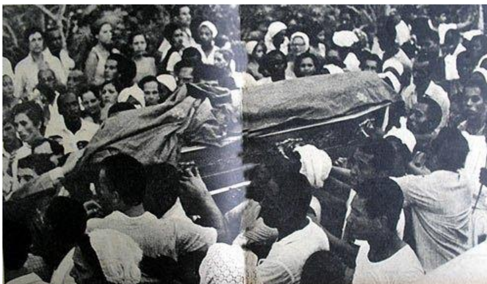
ENTERRO DO PAI DE SANTO