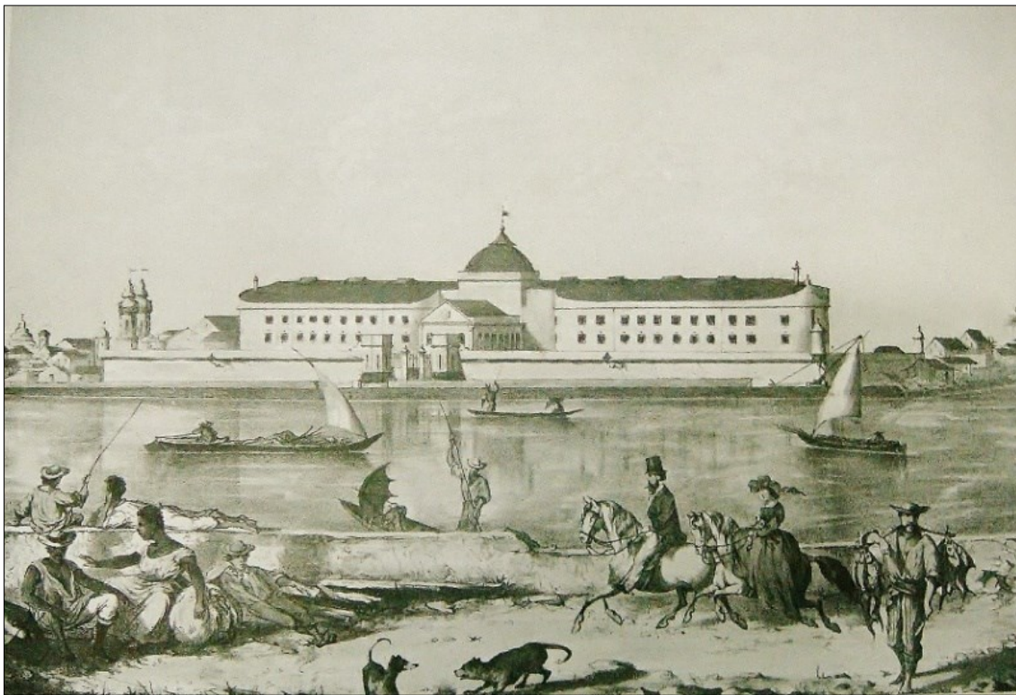
Figura 1 – Casa de Detenção do Recife, por Luís Schlappriz, 1863.