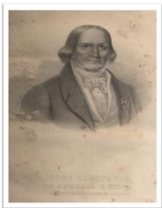
Figura 9 – Retrato de José Bonifácio de Andrada e Silva.