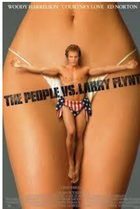
Cartaz censurado do filme 7 .

(“The People vs. Larry Flynt”, dir. Milos Forman, 1996)