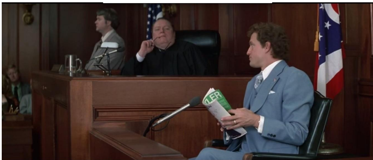
Cena onde o verdadeiro Larry Flynt (interpretando o juiz) e a personagem estão no tribunal de Hamilton County. (00:34:56) 18 .

Essa cena é bastante relevante, pois, a equipe de Forman a desenhou de modo que, quando a personagem é questionada sobre o que vê, o espectador tem diante de seus olhos os dois Flynts (a personagem e o "ator" na pele de juiz) afirmando ser aquilo tudo uma grande brincadeira. Portanto, o que se vê na película não é o que "realmente aconteceu", mas sim, o olhar de Flynt sobre o sistema jurídico de sua época, ou seja, uma piada, tal qual um Papai Noel excitado.