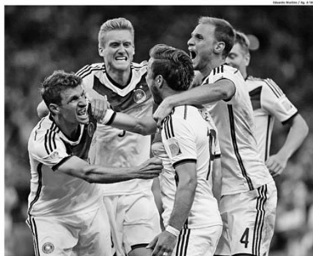
Jogadores da Seleção da Alemanha explodem de alegria ao comemorar o gol de Götz (C) que valeu o título da Copa do Mundo 2014