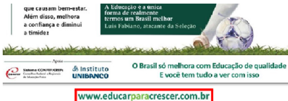
Imagem 2: Campanha da Editora Abril divulgada através de crossmídia na Super Interessante 17

Além da utilização da crossmídia para o jornalismo nesses dois casos, o espectador pode ser guiado com finalidades de propaganda e marketing. Em outras palavras, não existindo aprofundamento do tema (característico da transmídia) ou convergência do conteúdo, porém apenas divulgação e publicidade. A narrativa crossmidiática usada com este fim (de publicidade e marketing) pode ser exemplificada ainda com um caso na revista Super Interessante – ver Imagem 2. Nesta situação, a Editora Abril se utiliza da crossmídia na revista para promover sua campanha.