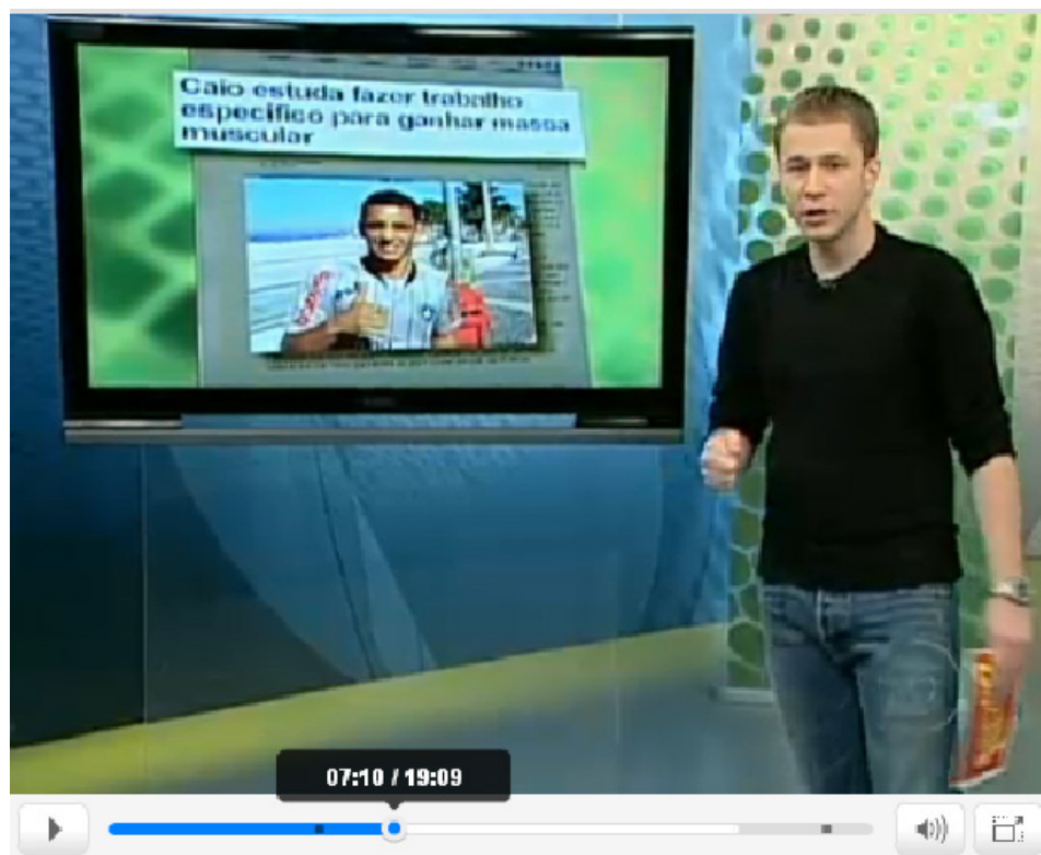
Imagem 4: Thiago Leifert indica site Globo Esporte como fonte de matéria do programa. 20

indicação direta (com crossmídia ou com hiperlinks, no caso de materiais convergidos), exigindo que o espectador e o pesquisador consumam os conteúdos de uma mesma empresa através de suas várias mídias, analisando se determinado assunto obteve ampliação em outro meio. Embora seja mais comum que as narrativas aconteçam entre TV e web, sobretudo desta para aquela, em 20 de julho, observamos crossmídia e transmídia da web para a TV (ver Imagem 4). Nesta situação, o apresentador do programa televisivo Globo Esporte, Thiago Leifert, complementa uma notícia veiculada no portal Globo Esporte, indicando a mesma numa tela colocada no estúdio.