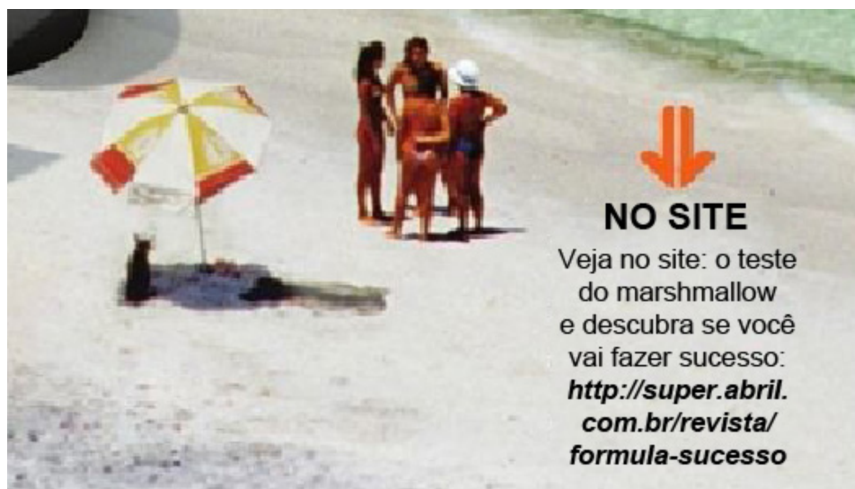
Imagem 1: Crossmídia na Super Interessante por motivos de convergência e transmídia

Além da utilização da crossmídia para o jornalismo nesses dois casos, o espectador pode ser guiado com finalidades de propaganda e marketing. Em outras palavras, não existindo aprofundamento do tema (característico da transmídia) ou convergência do conteúdo, porém apenas divulgação e publicidade. A narrativa crossmidiática usada com este fim (de publicidade e marketing) pode ser exemplificada ainda com um caso na revista Super Interessante – ver Imagem 2. Nesta situação, a Editora Abril se utiliza da crossmídia na revista para promover sua campanha.