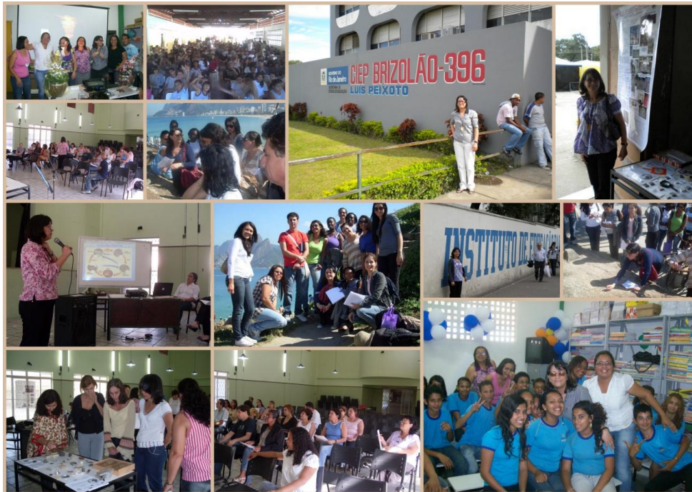
Figura 1. Conjunto de imagens de momentos das apresentações e estudos, relativos às atividades desenvolvidas pelo projeto: palestras, cursos, feiras de ciências e trabalhos de campo, ressaltando a imagem da escola parceira, CIEP Luís Peixoto, 396, do município de Queimados, RJ.