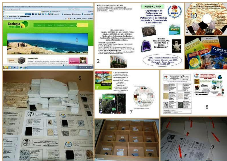
Figura 2. Conjunto de imagens de materiais distribuídos pelo projeto às escolas e à sociedade em geral: 1- Aspecto do site do projeto, 2- Folder de divulgação do minicurso, 3- CDs incluindo os conteúdos de rochas ornamentais 4- Livro de geografia da quinta série de conteúdo básico dos PCNs, 5- Fichas com amostras de slabs de rochas, 6- Caixas contendo amostras de minerais e rochas apresentadas nas feiras de ciências, 7- Livros de ciências de conteúdos básicos dos PCNs, imagem da excursão geológica do Parque Municipal de Nova Iguaçu, e CD de rochas, 8- Folder de minicurso de uma experiência anterior e mostruário de amostras com slabs doados para escolas públicas e a sociedade em geral, 9- Material de apoio didático oferecido aos participantes durante os cursos.