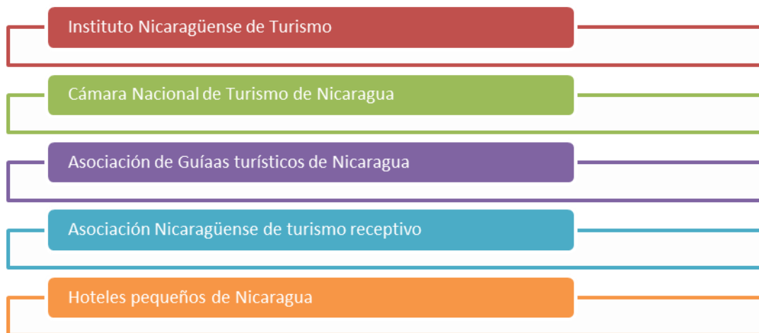
Figura 5. Instituciones rectoras y de apoyo para la gestión de la actividad turística en Nicaragua.

Bajo estas normativa existe las siguientes instituciones tanto rectoras, como de apoyo para la gestión turística de Costa Nicaragua(véase figura 5):