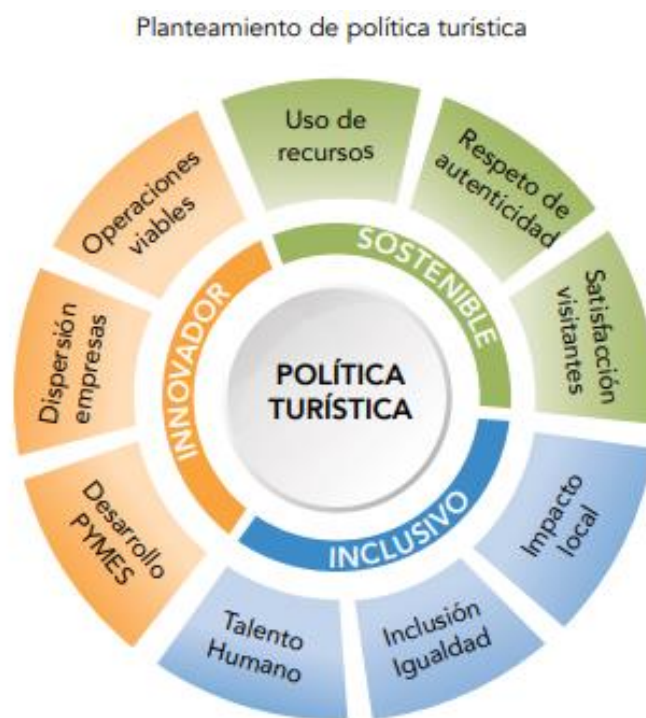
Figura 6. Ejes que considera la política de turismo de Costa Rica. Fuente: Plan Nacional de Desarrollo Turístico de Costa Rica 2017-2021

Entiendo una política pública como la decisión que desarrolla determinada acción orientada a resolver problemas públicos relevantes que incluye la toma de decisiones, su formulación, desarrollo y evaluación (MIDEPLAN, 2016), podemos ver que los gobiernos centroamericanos han considerado el turismo como una prioridad por atender, siendo este el caso de Costa Rica, el cual en su Plan de Desarrollo Turístico 2017-2021 ha establecido una serie de políticas que permiten atacar las deficiencias de la actividad y reorientar la actividad hacia un enfoque más sostenible tomando como punto de partida lo definido en los Objetivos para el Desarrollo (ODS) de la Organización de las Naciones Unidas (ONU) (véase figura n°6):