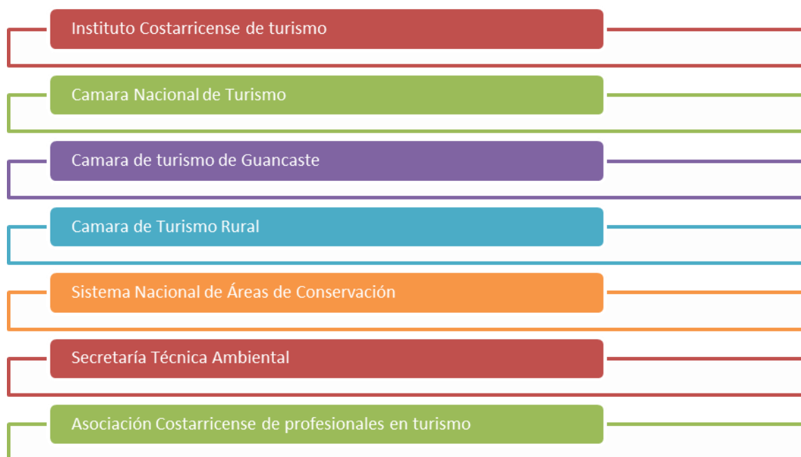
Figura 4. Instituciones rectoras y de apoyo para la gestión de la actividad turística en Costa Rica.

Bajo estas normativas existen las siguientes instituciones tanto rectoras, como de apoyo para la gestión turística de Costa Rica (véase figura 4):