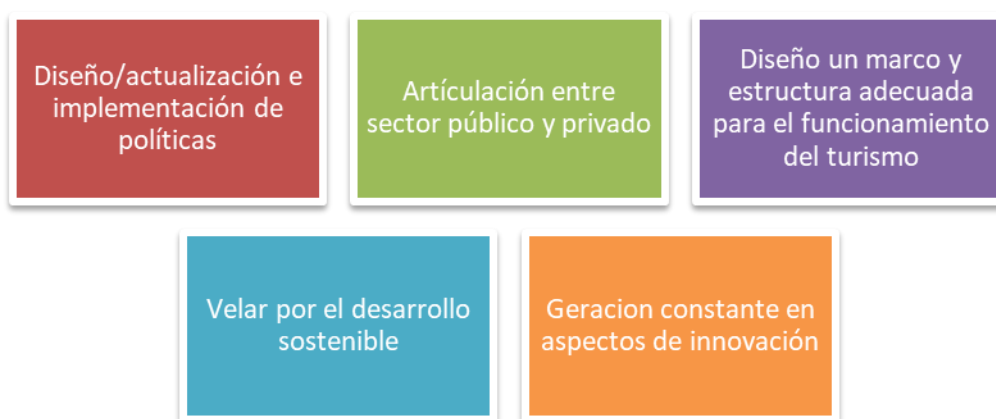
Figura 3. Tareas de la institucionalidad.

Como señala Instituto Latinoamericano y del Caribe de Planificación Económica y Social-ILPES(2003) , algunas de las tareas principales de la institucionalidad turística son(véase figura n° 3):