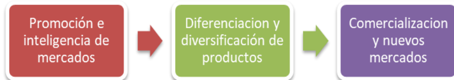
Figura 7. Estrategia turística de Desarrollo Sostenible de Nicaragua. Fuente: Elaboración propia con base en el PNDT de Nicaragua

Por otro lado, el país nicaragüense cuenta con algunas herramientas de política pública, en este sentido el principal instrumento es sentido el Plan Nacional de Desarrollo Turístico de Nicaragua (PNDT) el cual su última versión corresponde al año 2011-2020, este determina estrategias de desarrollo turístico las cuales están enfocadas en los siguientes elementos (véase figura n°7):