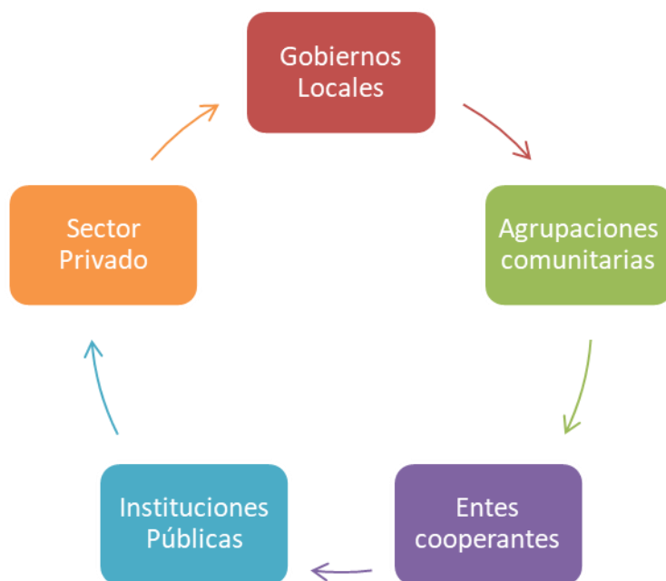
Figura 1. Actores clave dentro de los procesos de gestión participativa.

sector privado y la participación de múltiples agentes en los encadenamientos multisectoriales (véase figura 1). (IICA, 2002)