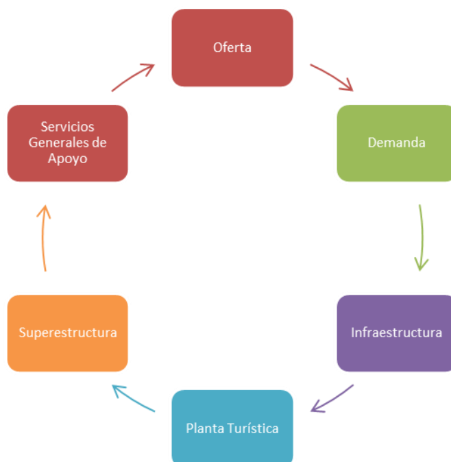
Figura 2. Actores clave dentro de los procesos de gestión participativa.

A nivel turístico la generación de redes debe partir desde la valoración del clúster, el cual está compuesto por los siguientes elementos (véase figura 2):