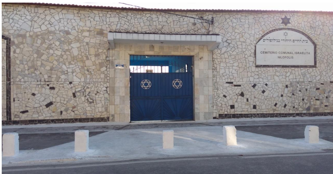
Figura 3: Fachada do Cemitério Comunal Israelita de Nilópolis.