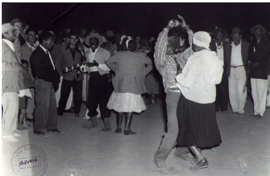
Figura 4 – Umbigada de São Benedito – 1952