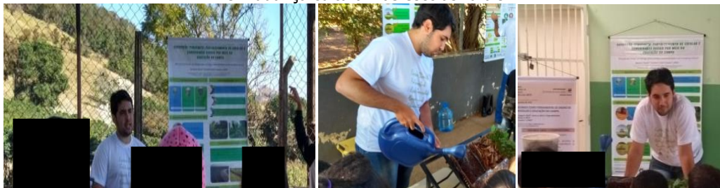
Figura 3 – Exposição interativa sobre um diálogo sobre ecologia, sustentabilidade rural e mudança cultural nas escolas rurais.

A exposição com maquetes interativas enfatizou as práticas de manejo e a conservação do solo e da água, demonstrando possíveis alternativas como ações para os problemas decorrentes do uso incorreto do solo como a construção de curvas de nível e bacias de retenção de água, impedindo o assoreamento e eutrofização dos mananciais e redução da fertilidade do solo.