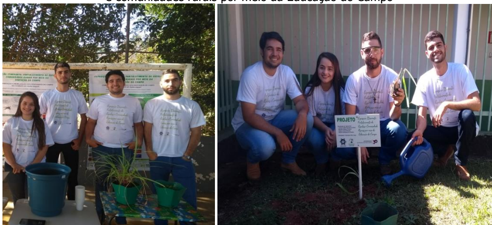
Figura 1 – Equipe que realizou a Exposição Itinerante: fortalecimento de escolas e comunidades rurais por meio da Educação do Campo