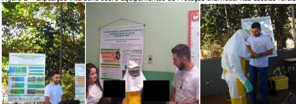
Figura 2 – Exposição interativa sobre Equipamentos de Proteção Individual nas escolas rurais.

A exposição referente ao subprojeto I foi realizada com auxílio de um banner, onde foi mostrada a importância em se utilizar os EPIs, as doenças causadas a curto e longo prazo devido à exposição a defensivos agrícolas, ao seu mau uso ou a sua não utilização. Ao mesmo tempo, foi abordado como proceder em caso de intoxicação por defensivos agrícolas.