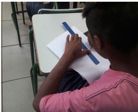
Figura 1- Aluno realizando atividades de Geometria Plana na sala de aula

O trabalho teve início com o estudo de alguns axiomas da Geometria e com atividades sobre área e perímetro envolvendo certas situações cotidianas, realizadas com papel, régua, lápis e borracha (Fig.1). O professor falou da Geometria Plana, localizando e descrevendo-a em ambientes da comunidade. Essa apresentação oral e visual, num primeiro momento, se fez dentro da sala de aula, com a participação direta dos alunos e do professor.