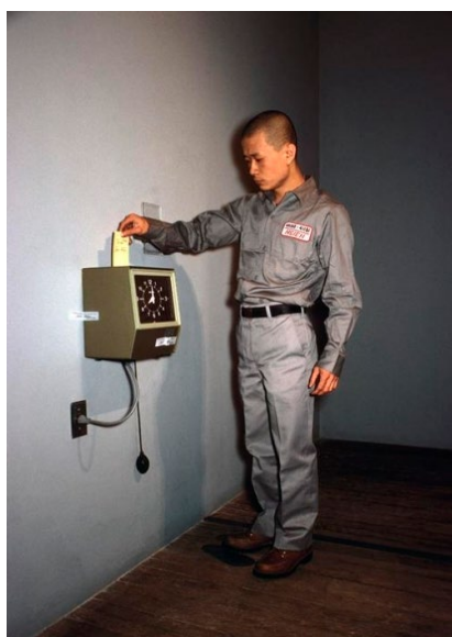
Figura 2 Tehching Hsieh. One Year Performance , 1980-1981 ( Time clock piece ). 11 de abril de 1980 a 11 de abril de 1981. Instalação, técnica mista, dimensões variáveis. Fonte: HSIEH, 198

É muito significativa a presença do nome do artista no lugar onde convencionalmente estaria o emblema da fábrica, e aqui se poderia sugerir agora que o sujeito está comprometido sobretudo consigo mesmo, com a performance ininterrupta de ser ele mesmo. Neste caso, as figuras do empregador e do empregado, do explorador e explorado, coincidem, “é agressor e vítima ao mesmo tempo” 8 . Seis minutos do mesmo é o que resta de um ano em que o artista se colocou em estado de funcionamento e administração constante de si mesmo, fracassando em seu empreendimento apenas quando foi vencido pelo próprio corpo que, quando exausto, não conseguiu extrapolar os próprios limites. Não deixa de ser revelador o relatório final realizado pelo artista, “indicando quando e por que ele perdeu cada uma dessas horas (a maioria delas, noventa e quatro vezes, foi por estar dormindo)” 9 .