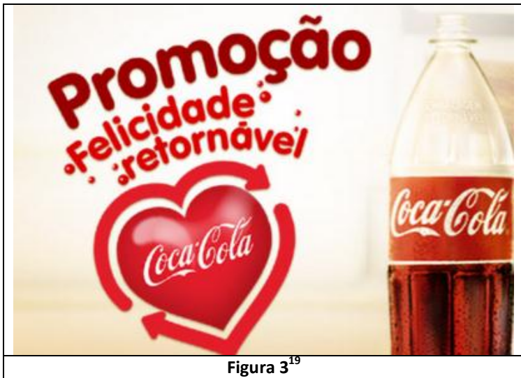
Figura 3 19

típicas de enunciados (BAKHTIN, 2011), ou gêneros discursivos, e a palavra é inserida nesse projeto discursivo. Entenderemos como isso se realiza num estudo em sala de aula. Numa aula de Língua Portuguesa em que se discute o funcionamento do substantivo, há como sugestão de análise uma propaganda da Coca-Cola :