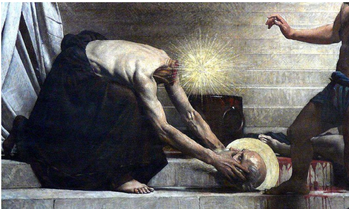
FIGURA 1. Le martyre de Saint Denis, Leon Bonnat, 1874-88 – detalhe

Nesse contexto, uma pergunta parece inevitável: que tipo de inteligência pode ser desenvolvida, uma vez que o acúmulo de informações característico da erudição se encontra disponível o tempo todo nas redes? A capacidade de articulação e de escolha dos saberes que interessam, em meio a tamanha oferta, parece ser o mote dessa nova inteligência. Essa “cabeça translúcida”, que permanece sobre o pescoço enquanto se carrega a outra a tiracolo, diz respeito à capacidade que temos de pilotar nossas próprias trajetórias, nos autoconstruirmos – e, como tal, é inalienável.