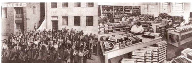
Figura 1. Fábrica de acordeões, 1939 (TODESCHINI, [2006?]).