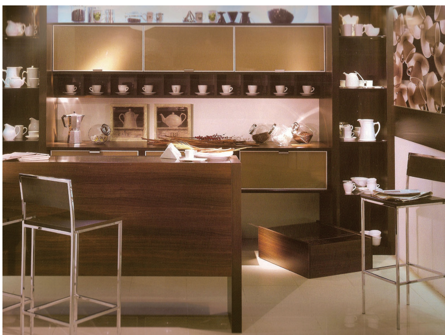
Figura 10. Cafeteria Málaga e Caramelo da Todeschini (TODESCHINI, 2006, p. 81).