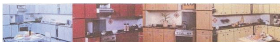
Figura 4. Cozinhas moduladas, década de 1970 (TODESCHINI, [2006?]).