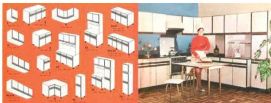
Figura 3. Cozinha modulada da Todeschini, 1968.

Na época, as famílias Farina e Fontanari compraram as ações da família Todeschini e passaram a ter o controle acionário da empresa. “Além de móveis de cozinha, se fez móvel de escritório, móveis de sala, móveis de instituto de beleza, caixas camping, luminárias e uma série de produtos, sendo que o que despontou foi o projeto de cozinhas que nós chamávamos, na época, de cozinhas americanas” (Figuras 3 e 4), explicou o entrevistado A.